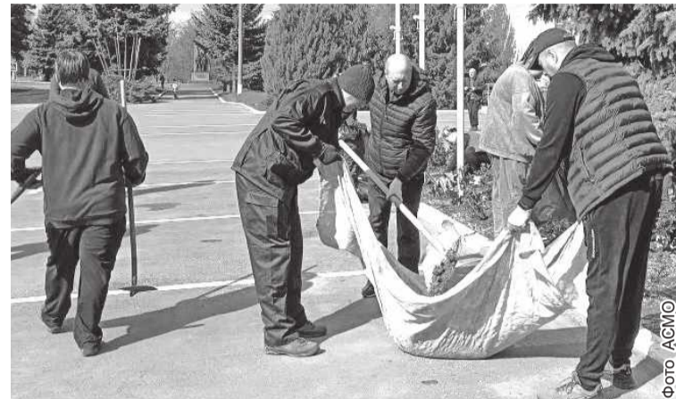
→ Участники субботника провели генеральную уборку прилегающей территории

25 апреля специалисты Администрации Славяносербского муниципального округа и депутаты Совета округа приняли участие во Всероссийском субботнике – масштабной экологической акции, объединившей жителей страны.