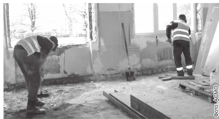
→ На объекте завершены комплекс демонтажных работ

В Славяносербске в рамках Народной программы «Единой России» продолжается капитальный ремонт поликлиники центральной районной больницы, который проводит регион-шеф Алтайский край.