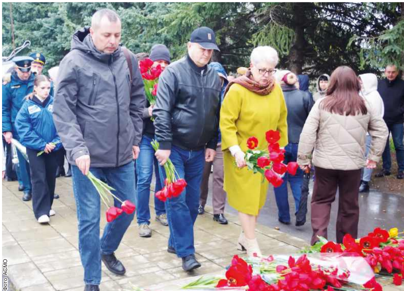
Участники митинга возложили цветы к мемориалу героев, чья жертва спасла миллионы жизней

В Славяносербске прошел митинг, приуроченный ко Дню памяти трагедии на Чернобыльской АЭС. Мероприятие объединило жителей округа, которые собрались, чтобы отдать дань уважения подвигу участников ликвидации последствий крупнейшей техногенной катастрофы – наших земляков, проявивших мужество, самоотверженность и силу духа.