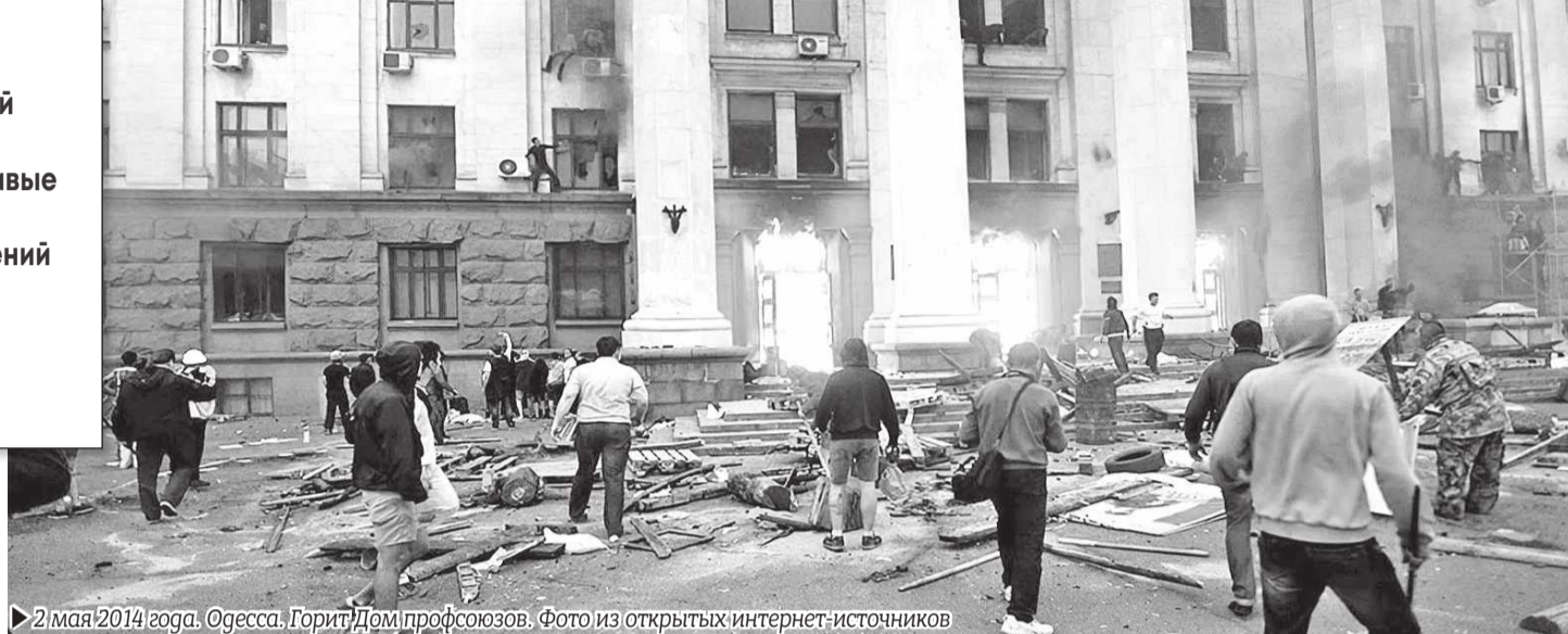
▶ 2 мая 2014 года. Одесса. Горит Дом профсоюзов.

Стоит отметить, что особого противостояния между местными приверженцами «майदानа» и «антимайдана» на тот момент не было. И это понятно, ведь все они жили в одном городе и меньше всего хотели войны. Для разжигания конфликта была задействована армия провокаторов, которых внедрились в ряды майдановцев и куликовцев.