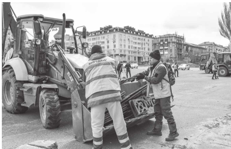
Демонтаж ограждения на площади Ленина

В историческом центре Алчевска, прямо по площади Ленина, «рассекают» экскаваторы. Что случилось? Долгожданное событие – стартовала реновация одного из любимых мест отдыха всех горожан.