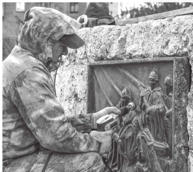
Специалисты восстанавливают барельефы – одну из важных деталей монумента

Сталь для 30-метрового монумента была выплавлена на Алчевском металлургическом комбинате.