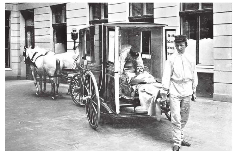
Первые кареты скорой помощи на Луганщине

Серьезным достижением Луганской скорой в шести-