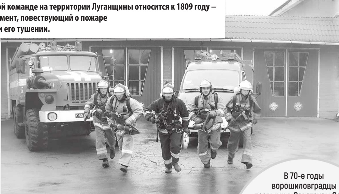
Пожарные ЛНР всегда готовы прийти на помощь

В июне 1942 года под массированным обстрелом на железнодорожном вокзале в Ворошиловграде оказалось 5 эшелонов без паровозов с оружием, взрывчаткой, горючим, ранеными. От взрыва бомбы загорелись две цистерны с горючим, огонь перекинулся на санитарный поезд. Оставшиеся