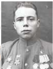
Александр Самойлович Шопин