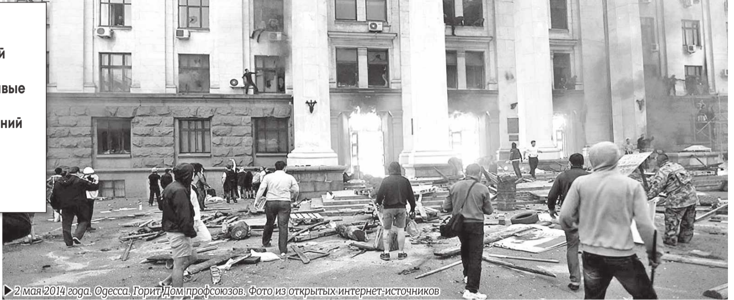
2 мая 2014 года. Одесса. Горит Дом профсоюзов.

Стоит отметить, что особого противостояния между местными приверженцами «майдана» и «антимайдана» на тот момент не было. И это понятно, ведь все они жили в одном городе и меньше всего хотели войны. Для разжигания конфликта была задействована армия провокаторов, которых внедрили в ряды майдановцев и куликовцев.