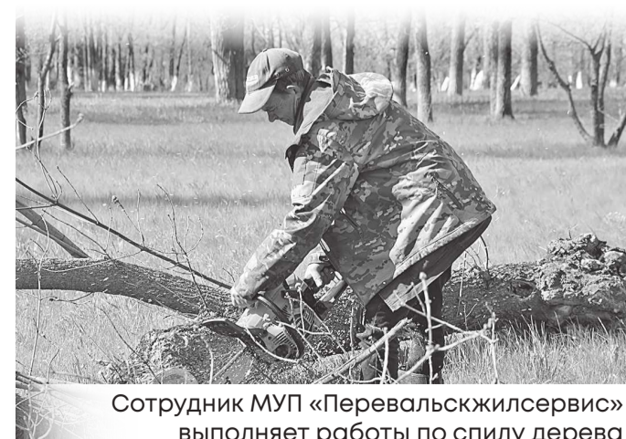
Сотрудник МУП «Перевальскжилсервис» выполняет работы по спилу дерева

– Именно с вопросами ремонта дорог жители обращаются чаще всего. В этом году погода внесла свои коррективы – были и снег, и дожди, но, несмотря на это, работы идут в хорошем темпе. Специалисты трудятся слаженно, в том числе и в выходные дни. Мы держим этот процесс на постоянном контроле, потому что понимаем, насколько это важно для жителей. Уже на этой неделе работы будут завершены, и люди смогут комфортно передвигаться по главным улицам города, – сказал он.