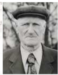
АЛЕХИН Петр Арсеньевич