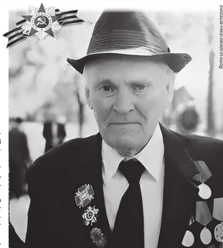
Фото из архива семьи ветерана