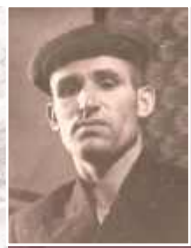
АНСЮТИН Григорий Трофимович