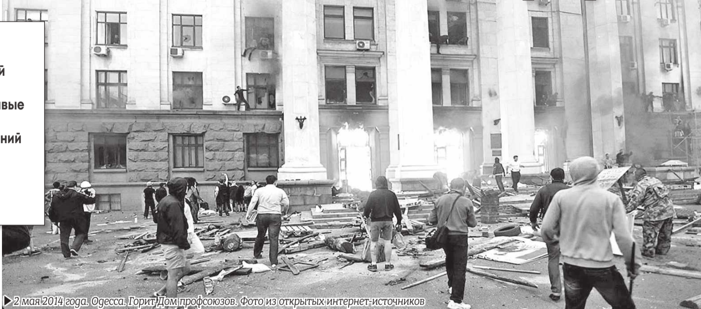
► 2 мая 2014 года. Одесса. Горит Дом профсоюзов.

Стоит отметить, что особого противостояния между местными приверженцами «майдана» и «антимайдана» на тот момент не было. И это понятно, ведь все они жили в одном городе и меньше всего хотели войны. Для разжигания конфликта была задействована армия провокаторов, которых внедрились в ряды майдановцев и куликовцев.