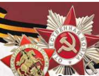
Становись в строй нашего «Бессмертного полка»!