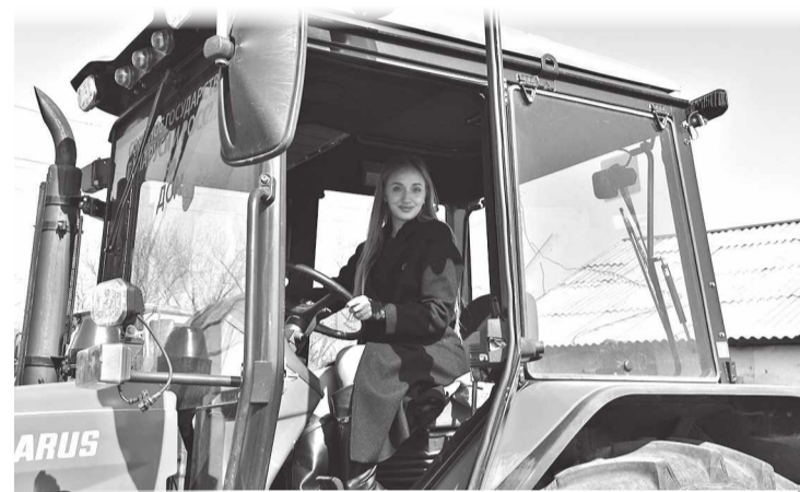
Почувствовать себя в роли тракториста получилось и у нас – за рулем с/х машины из автопарка колледжа

Рядом расположен кабинет первой помощи, где стоят учебные манекены для отработки навыков оказания помощи пострадавшим. Занятия проходят под контролем преподавателей, которые внимательно следят за тем, как студенты выполняют практические задания и отрабатывают действия в разных аварийных ситуациях.