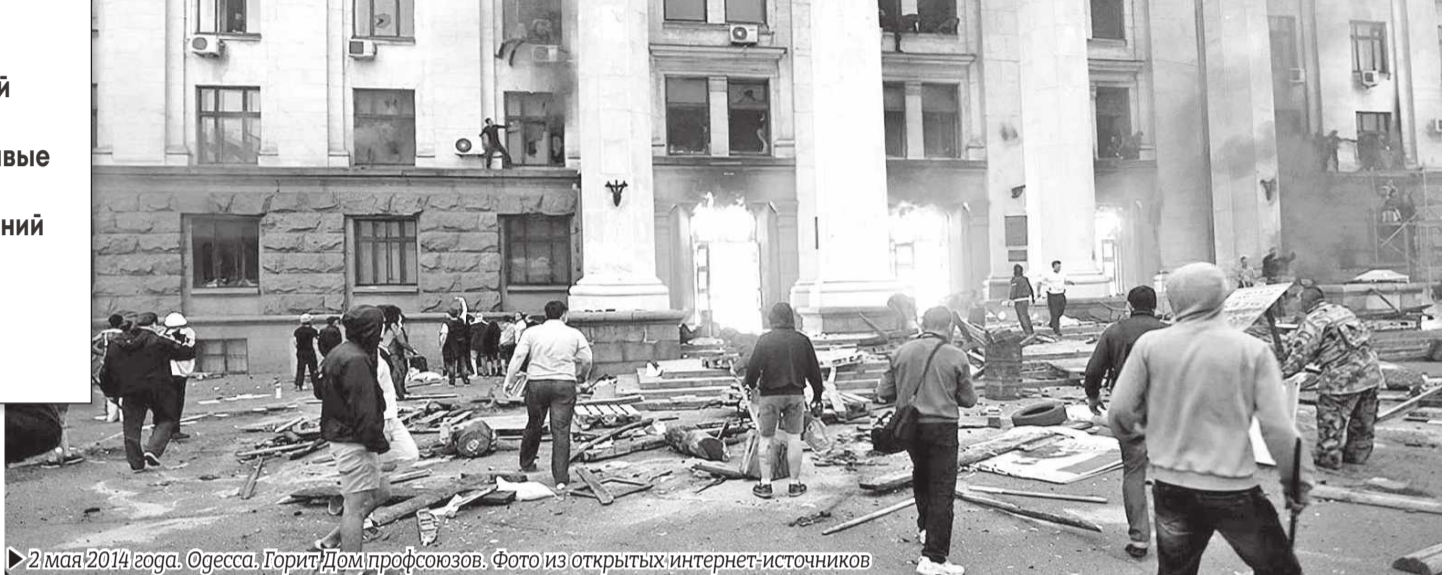
► 2 мая 2014 года. Одесса. Горит Дом профсоюзов.

Стоит отметить, что особого противостояния между местными приверженцами «майдана» и «антимайдана» на тот момент не было. И это понятно, ведь все они жили в одном городе и меньше всего хотели войны. Для разжигания конфликта была задействована армия провокаторов, которых внедрились в ряды майдановцев и куликовцев.