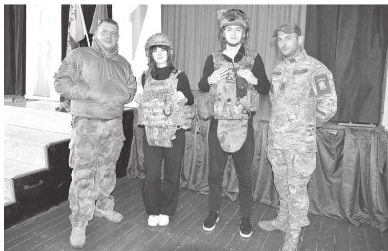
Участники «Движения первых» примерили экипировку бойцов

– Ежеминутно наши ребята в зоне СВО получают ранения