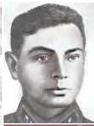
Железный Спартак Авксентьевич