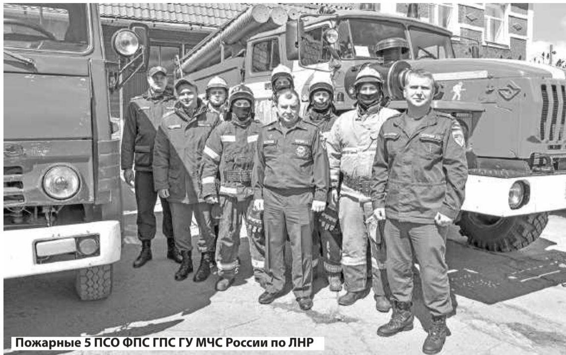
Пожарные 5 ПСО ФПС ГПС ГУ МЧС России по ЛНР

Первый и самый главный принцип решающего направления – это спасение людей!