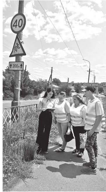
2026-м мы объявили второй сезон конкурса.

Реализован проект «Безопасная дорога к школе»: депутаты совместно с родительской общественностью, активиста-