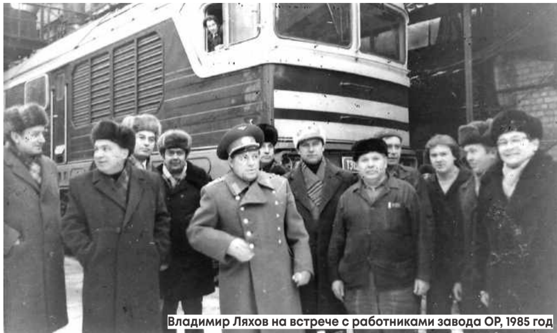
Владимир Ляхов на встрече с работниками завода ОР, 1985 год