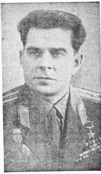
Летчик-космонавт, Герой Советского Союза Г. Т. Береговой.

Летчик-космонавт товарищ Береговой Георгий Тимофеевич доложил о том, что все системы корабля работают хорошо, давление и температура в отсеках корабля находятся в заданных пределах, и он продолжает выполнять намеченную программу экспериментов и исследований. Самочувствие товарища Берегового отличное. Он по-прежнему сохраняет высокую работоспособность.