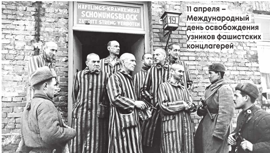
11 апреля – Международный день освобождения узников фашистских концлагерей