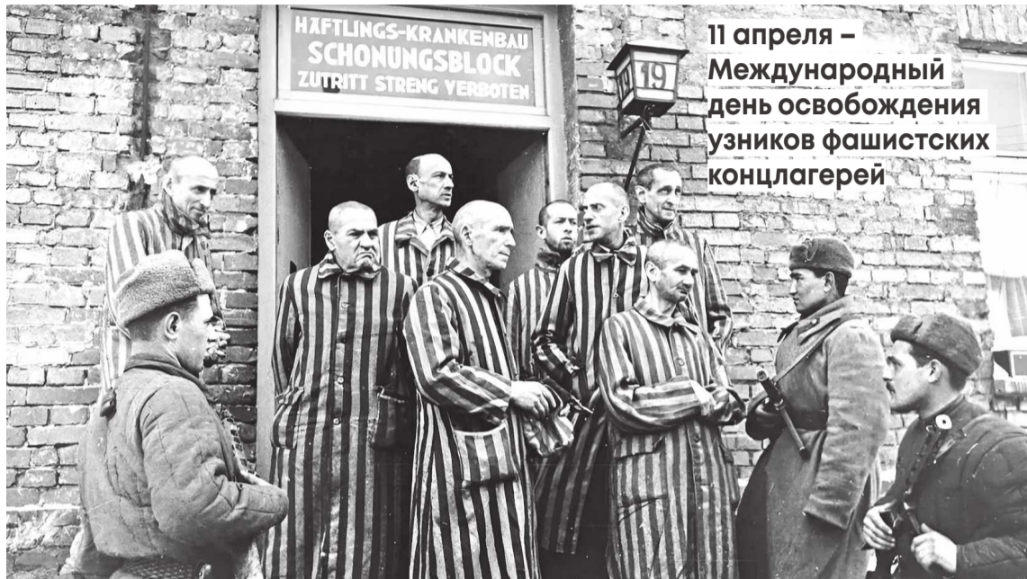
11 апреля – Международный день освобождения узников фашистских концлагерей