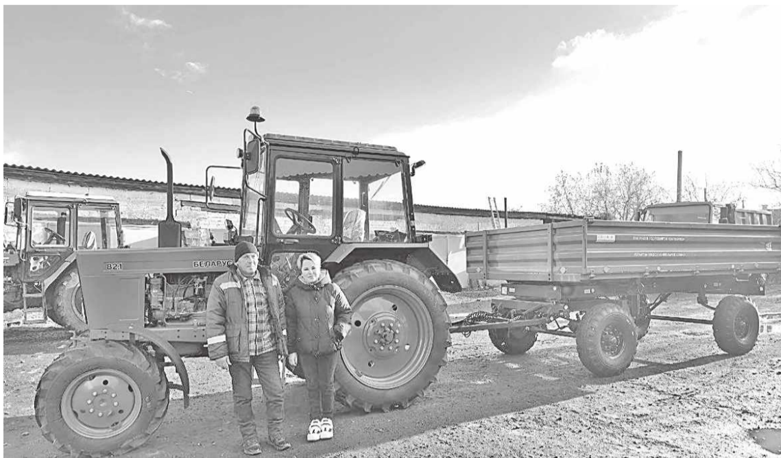
Новая техника предприятия – трактор «Беларус 82.1»

– Стараюсь говорить с ними на одном языке, доводить до сведения сотрудников, что происходит в организации, показывать, как их действия помогают в достижении поставленных целей. Это помогает наладить коммуникацию, нацелить работника на развитие и мотивировать на дальнейшие достижения. Главная наша задача – создать безопасные и комфортные условия для проживания людей, – акцентировала директор предприятия.