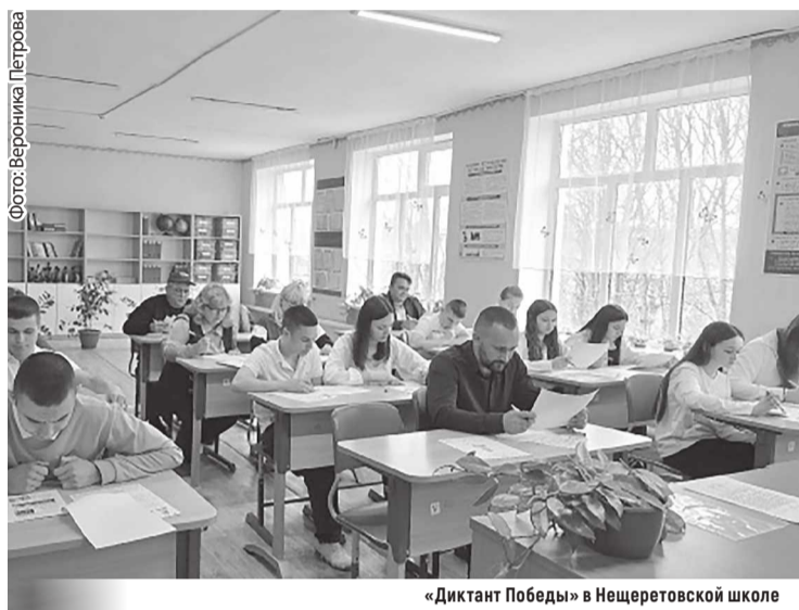
«Диктант Победы» в Нещеретовской школе

– Я считаю, что данная акция напоминает каждому из нас о подвиге наших прадедов и о той цене, которую заплатила страна за мирное небо над головой. «Диктант Победы» должен выступать весомым противодействием попыткам исказить нашу истинную историю.