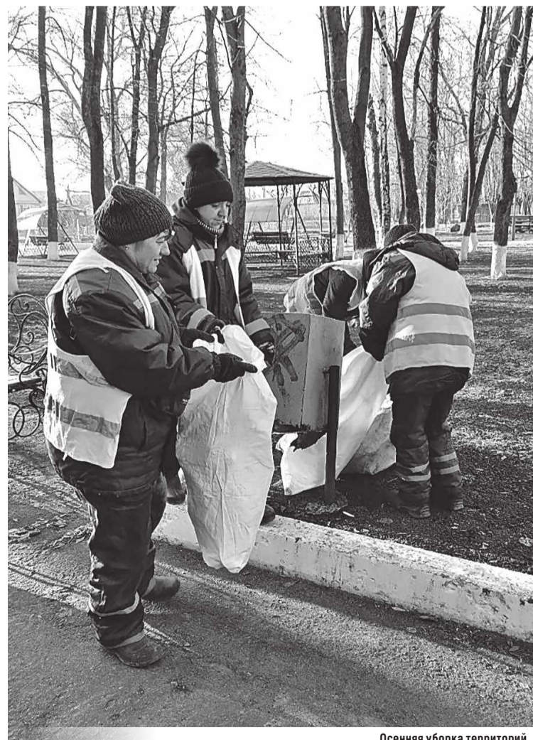
Осенняя уборка территорий

– Проблема взаимодействия с собственниками является одной из ключевых в нашей работе.