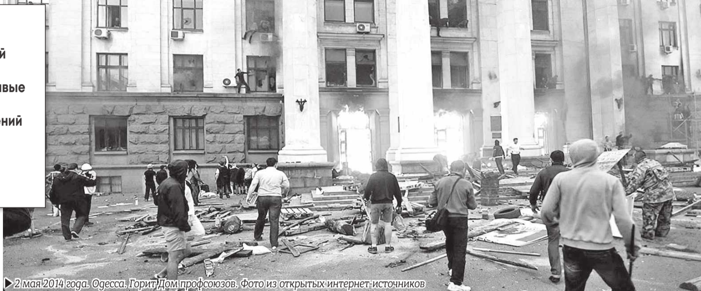
▶ 2 мая 2014 года. Одесса. Горит Дом профсоюзов.

Стоит отметить, что особого противостояния между местными приверженцами «майдана» и «антимайдана» на тот момент не было. И это понятно, ведь все они жили в одном городе и меньше всего хотели войны. Для разжигания конфликта была задействована армия провокаторов, которых внедрились в ряды майдановцев и куликовцев.