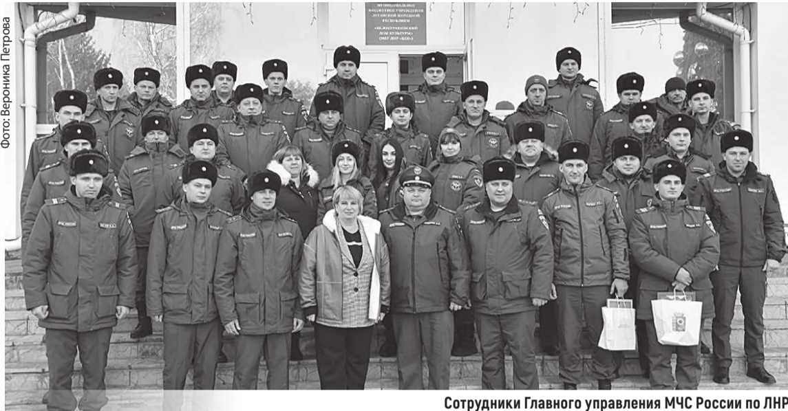
Сотрудники Главного управления МЧС России по ЛНР

В конце апреля в нашей стране отмечают День пожарной охраны России. Благодаря ее слаженной работе тысячи людей ежедневно остаются в безопасности, даже не задумываясь, сколько усилий за этим стоит.