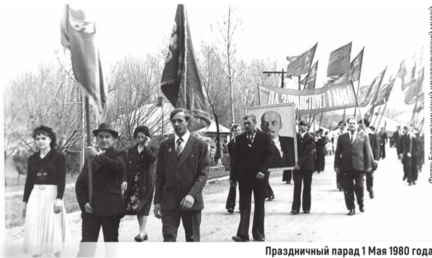
Праздничный парад 1 Мая 1980 года

День международной солидарности трудящихся – именно под таким названием вошел в историю Первомай. Спустя десятилетия он стал не так популярен, однако Праздник Весны и Труда является одним из самых любимых в России.