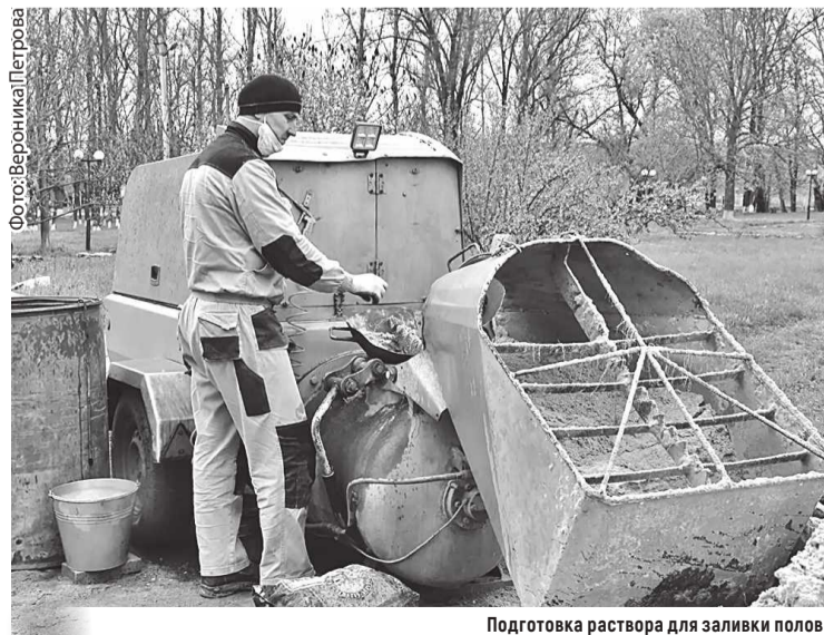
Подготовка раствора для заливки полов

В здании Белокуракинской детской библиотеки за счет средств Президентского фонда культурных инициатив начался капитальный ремонт здания.