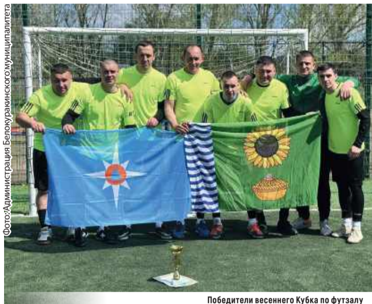
Победители весеннего Кубка по футзалу

Весенний Кубок по футзалу на открытых площадках подошел к завершению. В полуфинальных играх приняли участие четыре команды Белокуракинского округа: «МЧС», «Курячовка», «Паньковка», «Агро».