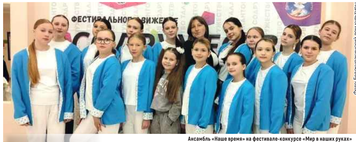
Ансамбль «Наше время» на фестивале-конкурсе «Мир в наших руках»

– Выступление оставило самые яркие и радостные воспоминания. Нам есть к чему стремиться, и надеюсь, что этот год для нашего коллектива будет таким же плодотворным, как и прошлый.