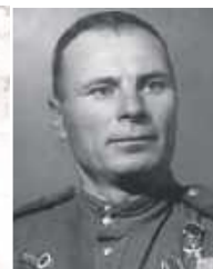
МАКАРЕНКО Тимофей Титович