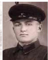
КРЕСТИНСКИЙ Николай Иванович