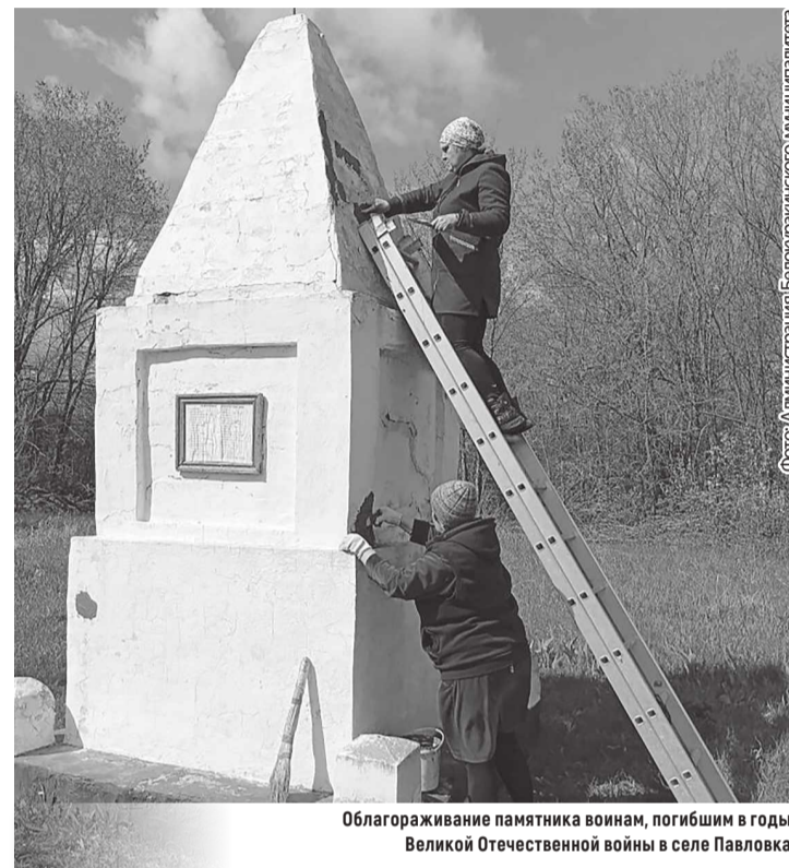
Облагораживание памятника воинам, погибшим в годы Великой Отечественной войны в селе Павловка

В преддверии Дня Победы сотрудники отделов по обеспечению жизнедеятельности сел активно благоустраивают территории возле памятников и братских могил.