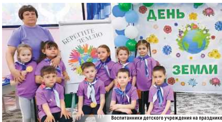
Воспитанники детского учреждения на празднике