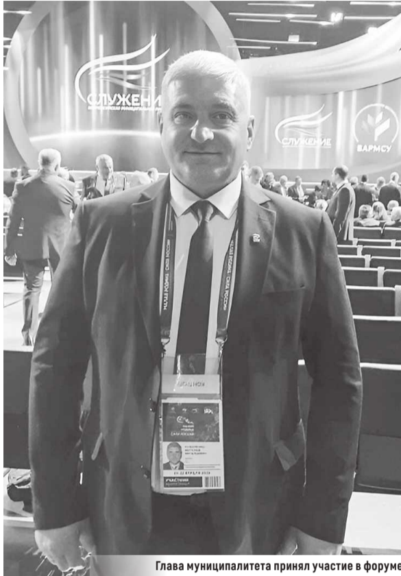
Глава муниципалитета принял участие в форуме

Кроме того, участие руководителя округа в таком масштабном мероприятии подчеркивает активную позицию Беловодщины в развитии местного самоуправления и ее стремление к интеграции в общероссийское пространство для достижения наилучших результатов в интересах жителей муниципалитета.