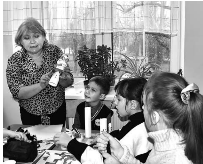
Мастер-класс по изготовлению новогодних украшений в УВК № 10

В УВК № 10 прошло мероприятие, приуроченное к Международному дню людей с ограниченными возможностями здоровья, который отмечается 3 декабря.