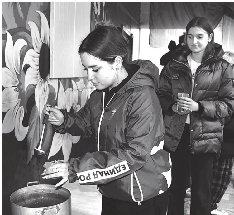
Волонтеры изготавливают блиндажные свечи