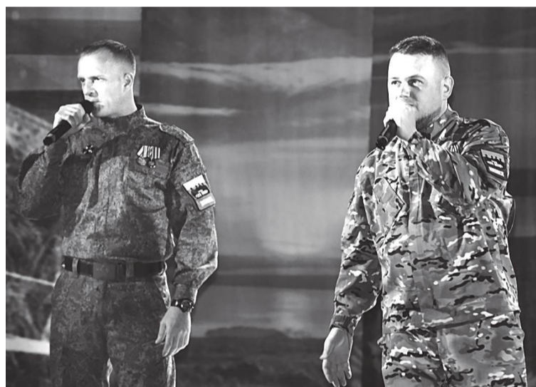
Выступает группа «123 Полк»

По зову сердца на предложение выступить на благотворительном концерте откликнулись артисты группы «123 Полк».