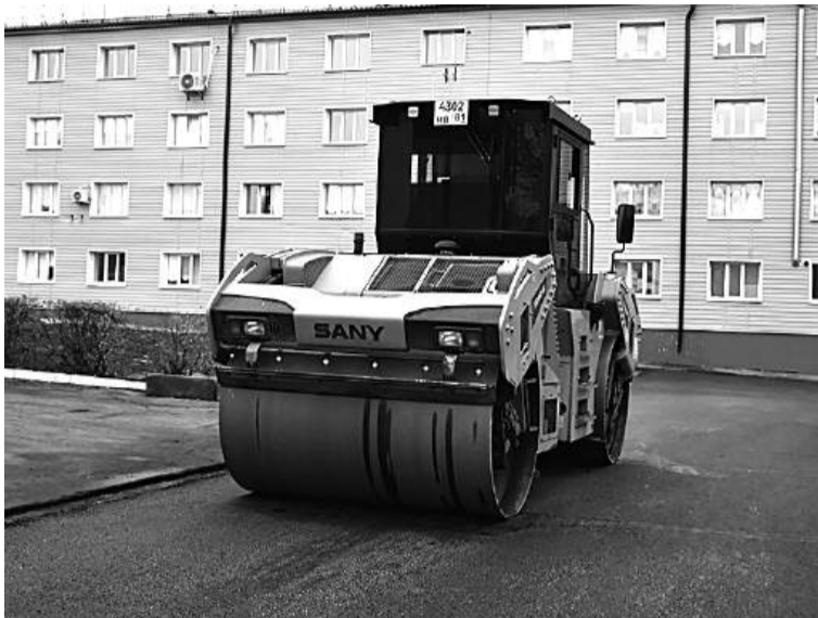
В числе отремонтированных за счет дополнительного финансирования участков – подъездная дорога к центральной городской поликлинике № 1

– Помимо дороги, полностью отремонтированы прилегающие тротуары. В оживленной зоне за остановкой «Нижнее микро», где расположены ма-