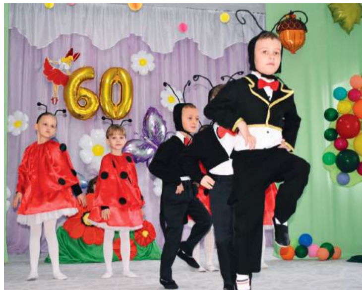
Воспитанники детского сада подготовили к юбилею концерт по мотивам сказки «Дюймовочка»

Анатолий Яцышин передал коллективу учреждения Благодарственный адрес от главы муниципалитета Евгения Морозова за многолетний плодотворный труд, создание атмосферы люб-