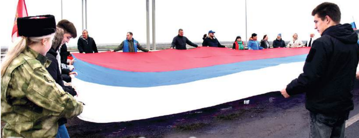
Участники акции вместе развернули масштабную копию российского триколора

ПО ИНИЦИАТИВЕ БРЯНКОВЧАН ПРЕДСТАВИТЕЛИ ДЕБАЛЬЦЕВО, БРЯНКИ И ЧЕТЫРЕХ РЕГИОНОВ-ШЕФОВ – БРЯНСКОЙ ОБЛАСТИ, ХАБАРОВСКОГО КРАЯ, ЧУКОТСКОГО АВТОНОМНОГО ОКРУГА И КАМЧАТКИ – ВСТРЕТИЛИСЬ НА ГРАНИЦЕ ЛНР И ДНР, ЧТОБЫ ПОЗДРАВИТЬ ДРУГ ДРУГА С ДНЕМ НАРОДНОГО ЕДИНСТВА.