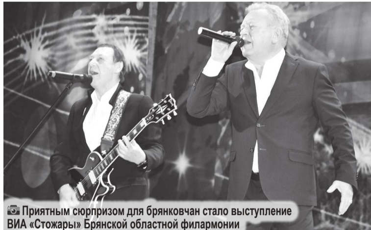
Приятным сюрпризом для брянковчан стало выступление ВИА «Стожары» Брянской областной филармонии