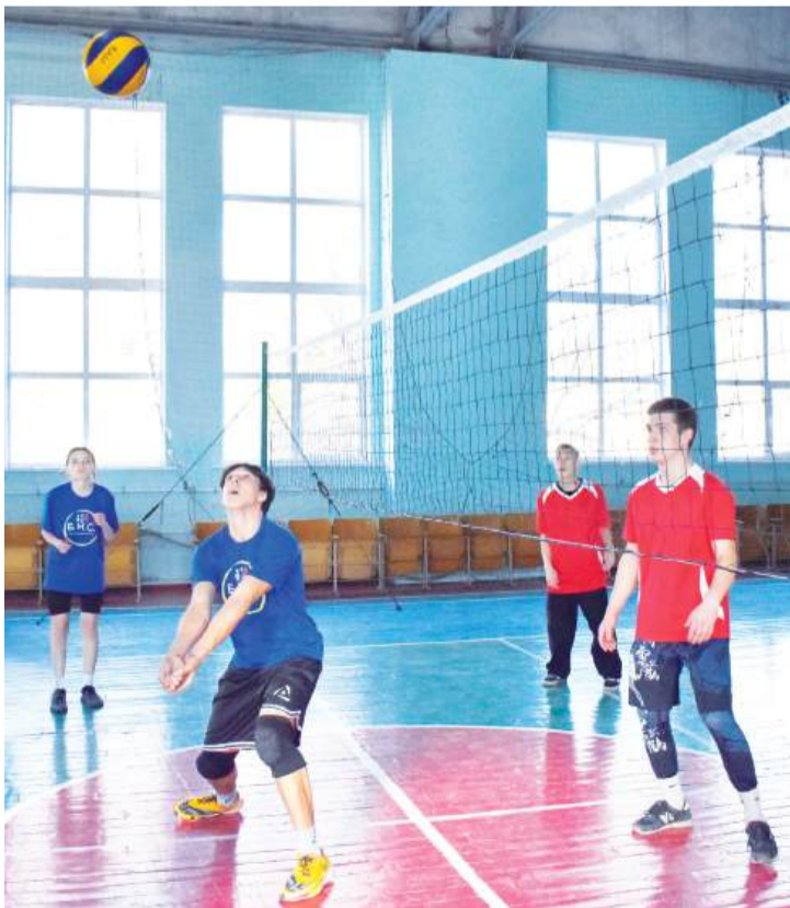
Матч в спортзале Брянковского колледжа ЛГПУ

Товарищеский матч по волейболу между командами Молодежного совета при Администрации города и Брянковского колледжа (филиала) ЛГПУ прошел 29 октября в рамках проекта «Сила России» партии «Единая Россия».