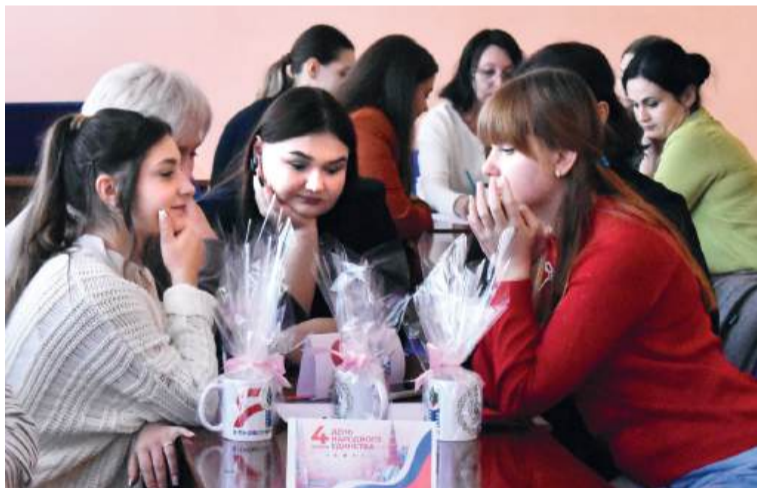
Молодые педагоги обдумывают ответ

Укрепление наставничества и закрепление профессиональных связей между молодыми и опытными педагогами – такую задачу поставили перед собой организаторы интеллектуально-познавательной викторины, прошедшей 30 октября в Доме детского и юношеского творчества.