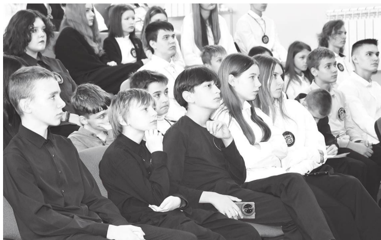
Учащиеся СШ № 9 – на презентации

– Грант – это больше, чем просто финансовая помощь, это настоящий социальный лифт для молодых людей, – отметила Виктория Скуратова. – Росмолодежь.Гранты – единственный в мире сервис, который выдает молодежи гранты на реализацию социальных инициатив и помогает воплотить мечты в жизнь.