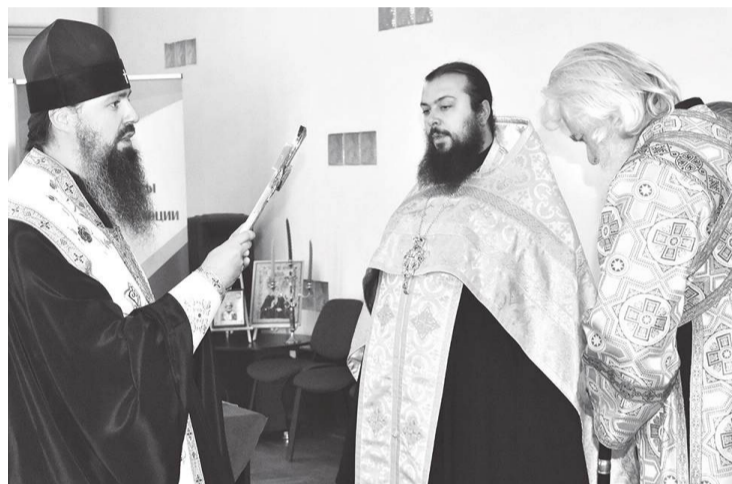
Представители духовенства провели обряд освящения Дворца культуры