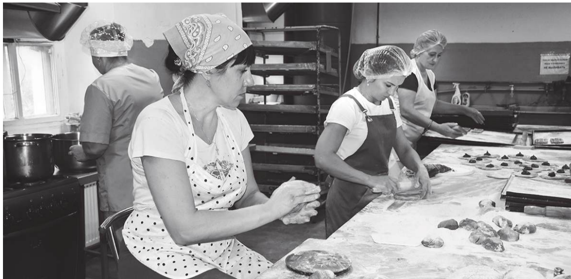
Рабочий момент в пряничном цеху

Они, как никто, знают, как сделать жизнь сладкой. Добро и счастье несут людям пряничных дел мастера, которые трудятся в брянковском цеху по производству кондитерских изделий.