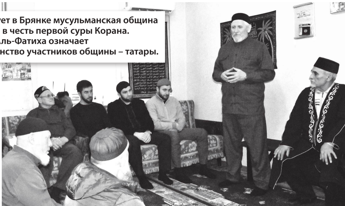
В брянковской мечети

С вхождением республики в состав России в брянковскую мечеть неоднократно при-