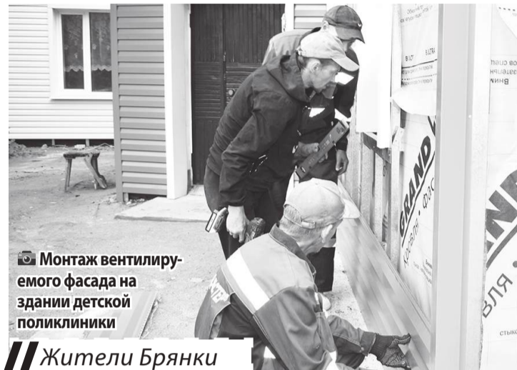
Монтаж вентилируемого фасада на здании детской поликлиники

В центре города в рамках федерального проекта «Формирование комфортной городской среды» национального проекта «Инфраструктура для жизни» продолжается благоустройство общественной тер-