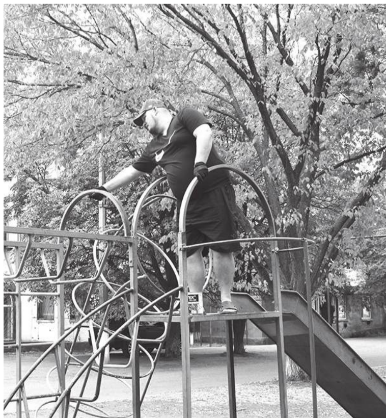
Активисты обновили детскую площадку в Краснополье

Активисты Брянковского местного отделения партии «Единая Россия» рапортовали в прошлом номере газеты о том, что сезон обновления детских площадок в рамках акции «Яркое детство» закрыт. Но передумали и решили сделать сюрприз детворе из отдаленного жилмассива.