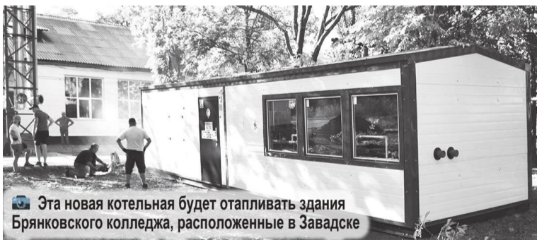
Эта новая котельная будет отапливать здания Брянковского колледжа, расположенные в Завадске

К работе по установке новых блочно-модульных котельных мощностью 0,6 МВт каждая тепловики ГУП «Брянсккомунэнерго» приступили 1 сентября.