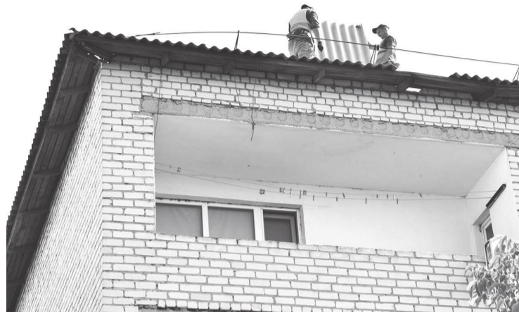
Ремонт шиферной кровли на доме № 8 на улице Богдана Хмельницкого