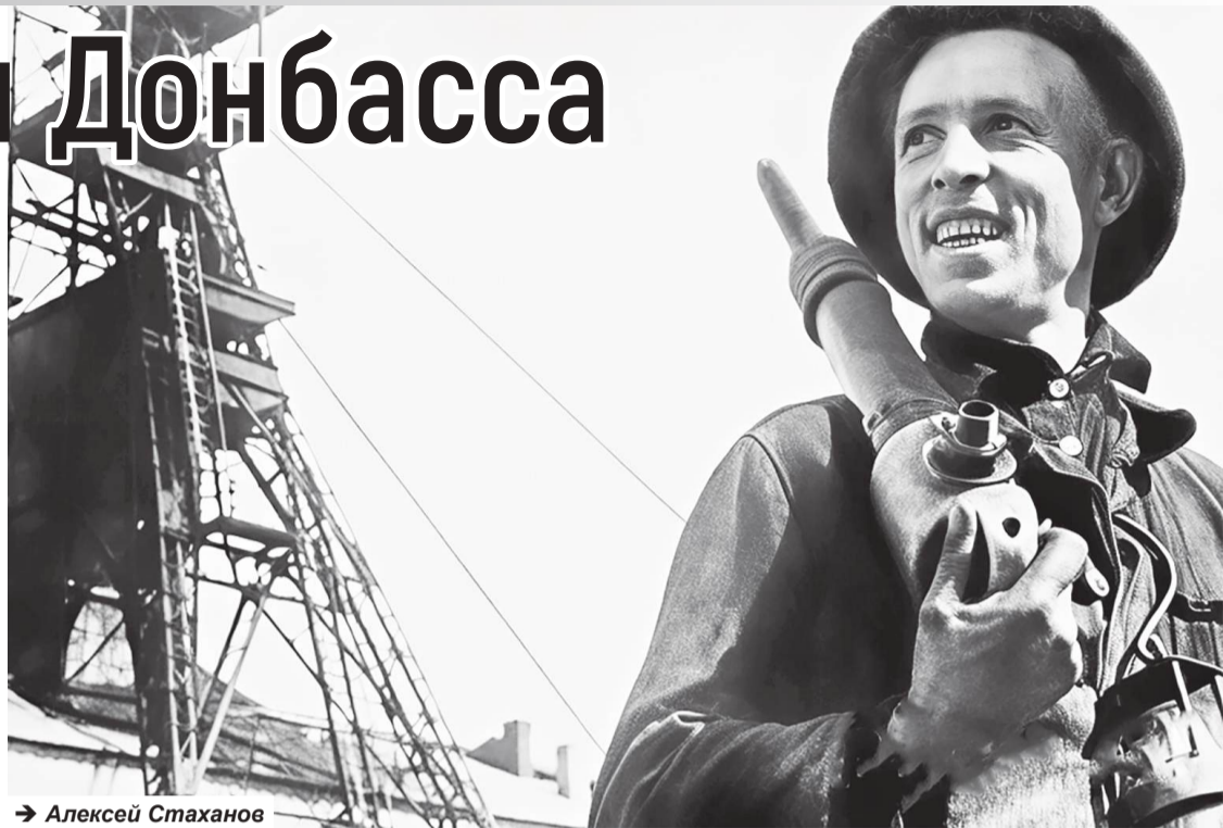
→ Алексей Стаханов

Тогда парторг сделал то, что до него еще никто не делал: говоря современным языком, он провел среди рабочих предприятия письменный социологический опрос. Были