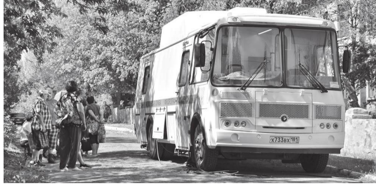
«Флюомам» в Замковке

Медработники анненской поликлиники № 5 провели выездной прием пациентов в Замковке.