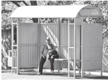
Новый павильон на остановке возле центральной горбольницы

В микрорайоне № 4 новый павильон установлен на остановке в районе Аллеи возрождения, которая благоустраивается в рамках федерального проекта «Восстановление (создание) инфраструктуры и содействие экономическому развитию Донецкой Народной