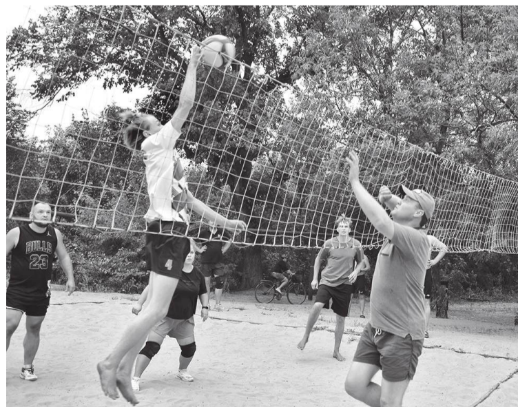
В финале встретились команды «Садоха» и «Заря»

демонстрировала высокий уровень подготовки и командный дух. Поздравляем победителей и призеров, а также всех участников, подаривших нам яркий спортивный праздник!