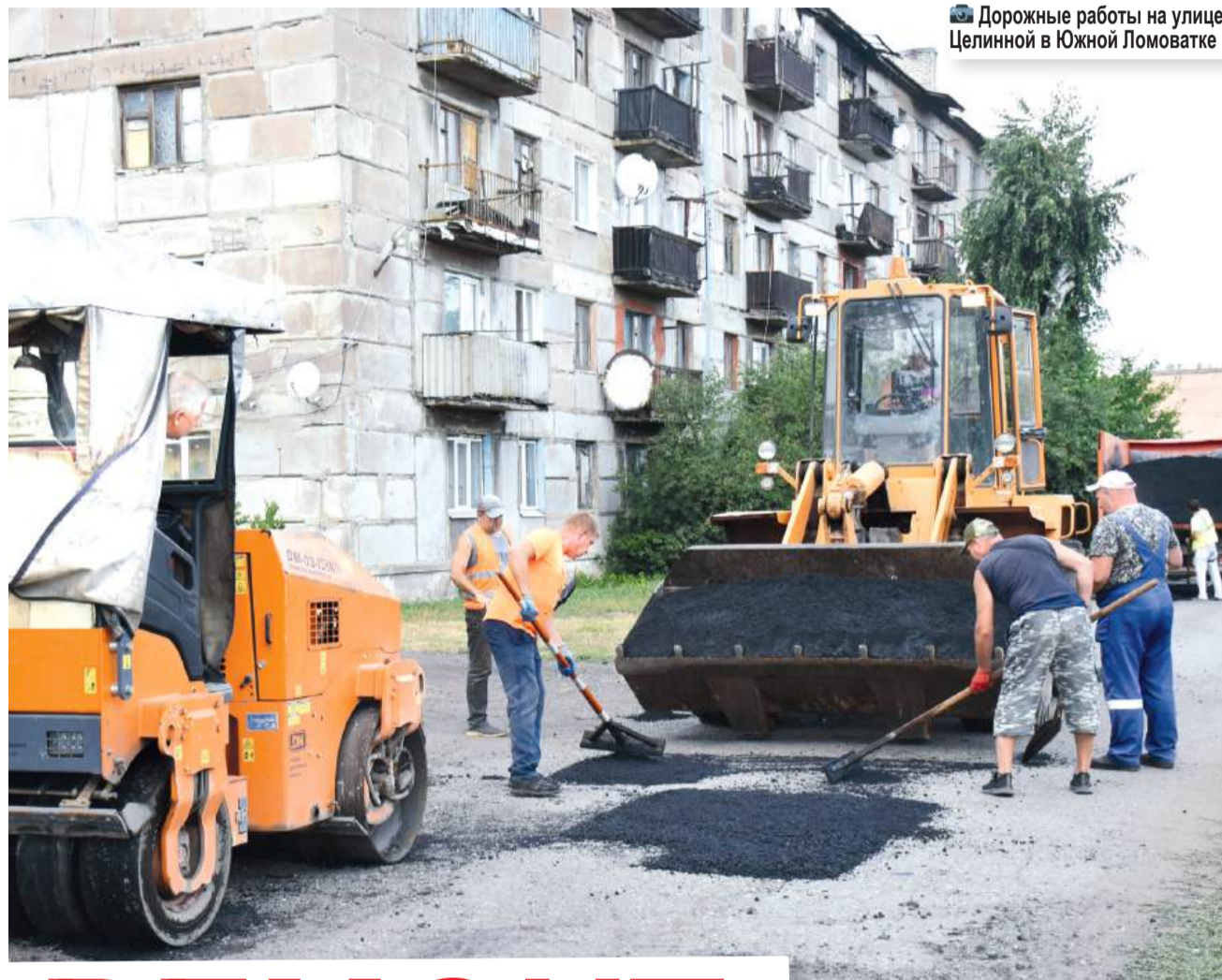
Дорожные работы на улице Целинной в Южной Ломоватке

– А значит, защитит жизнь и здоровье людей, поможет нашим военным более эффективно выполнять боевые задачи, – подчеркнул он. Запрет распространяется на публикацию в мессенджерах, социальных сетях, СМИ материалов, фиксирующих места и последствия вражеских атак, падение ракет и беспилотников, детонацию боеприпасов, позволяющих определить места расположения военных, топливно-энергетических и промышленных объектов. Запрещенные материалы будут удаляться из открытых источников в сети Интернет.