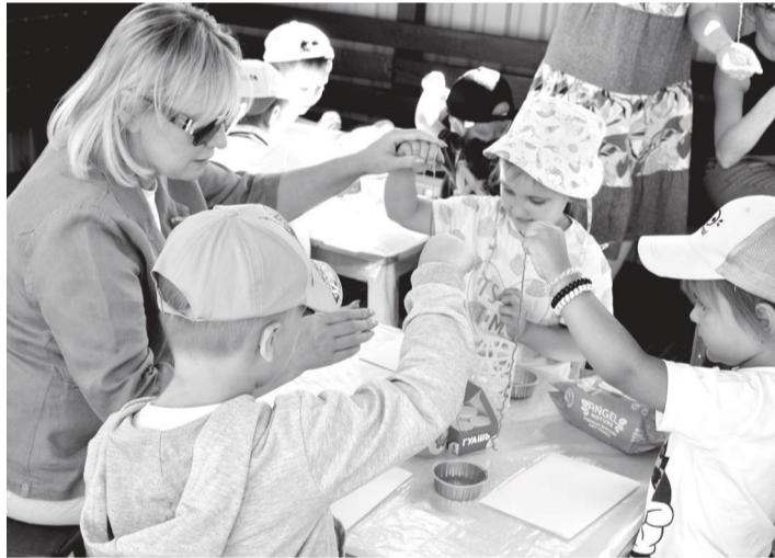
Воспитанники одной из групп детсада «Дюймовочка» учили гостей рисовать ниточками

В Брянке прошла приемка дошкольных образовательных учреждений к новому учебному году.