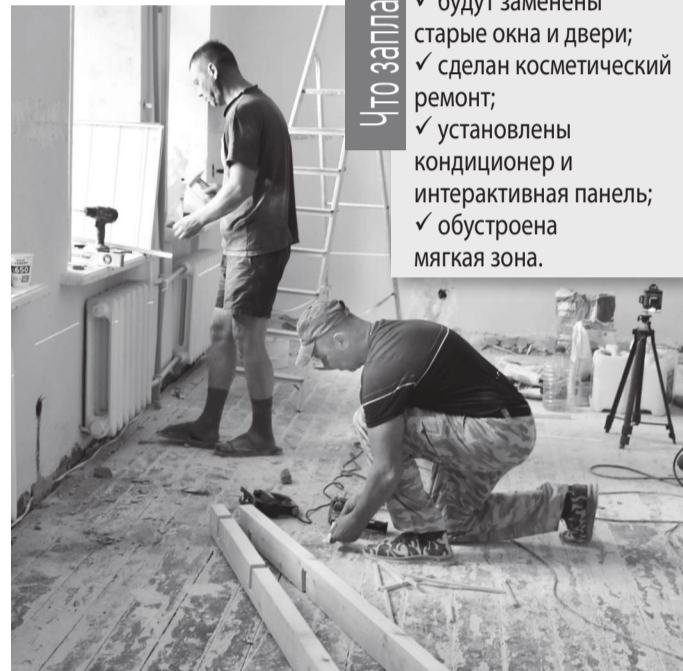
Ведутся ремонтные работы в помещении ДК, где в дальнейшем будет открыт Детский центр