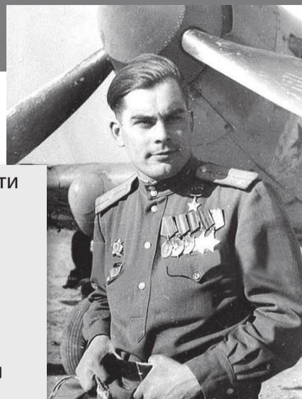
Участник Курской битвы дважды Герой Советского Союза Иван Михайличенко

кое поле. Колосья пшеницы гнулись к земле. Поют птицы. И вдруг – снопы огня. В наушниках мы услышали сигнал атаки: «Сталь! Сталь!» Это была страшная картина. От прямого попадания танки взрывались на полном ходу. Срывало башни, летели в стороны катки. Не было слышно отдельных выстрелов. Стоял сплошной грохот. Были мгновения, когда в дыму свои и немецкие танки мы различали только по силуэтам. Из горящих машин выскакивали танкисты и катались по земле, пытаясь сбить пламя...»