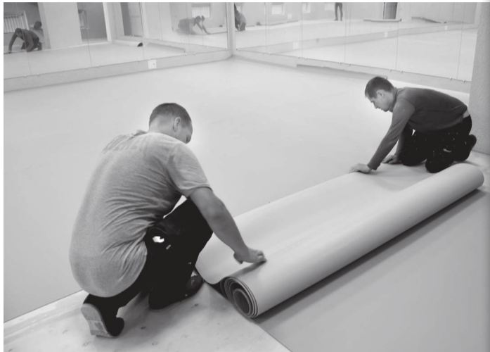
Ведется укладка линолеума в танцклассе Дворца культуры

Два года назад во Дворце культуры имени Октябрьской революции за бюджетные средства был проведен капремонт хореографического зала, где проводят занятия участники образцовых ритм-балета «Арс Нова» и народного ансамбля «Непоседы». В настоящее время близится к финишу капитальный ремонт танцевального класса.