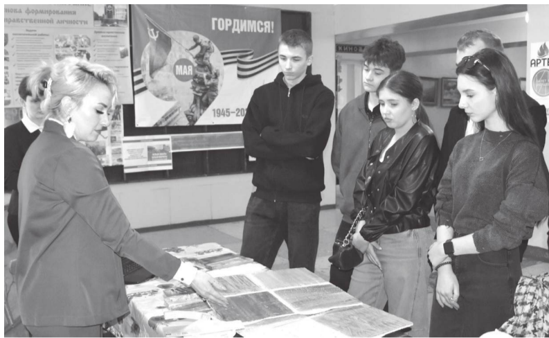
Презентация профессии «Мастер отделочных строительных и декоративных работ» для школьников прошла в Брянковском колледже в рамках Ярмарки трудоустройства – 2025.