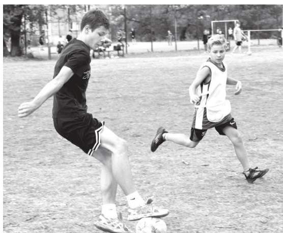
Первый тур соревнований по дворовому футболу прошел на поле в микрорайоне № 4. На фото – матч между командами «Донбасс» и ФК «Брянка»

– Рад видеть ребят, постоянно участвующих в данных соревнованиях, и тех, кто занимается футболом профессионально, а также самых юных участников турнира, которые только начинают дорогу в большой спорт.