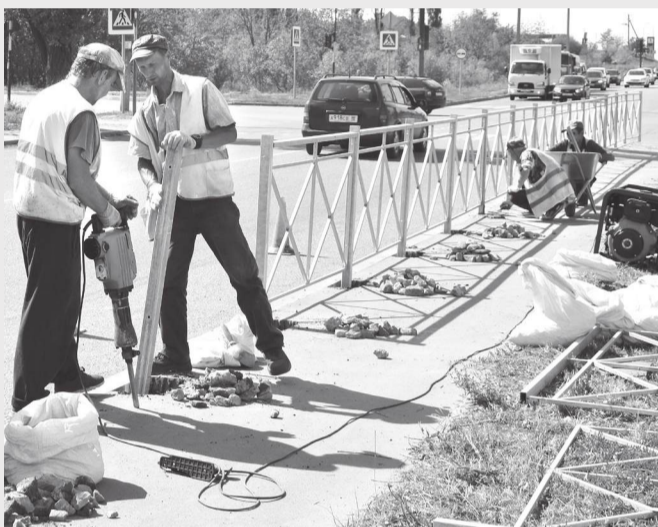
Монтаж барьерных ограждений вдоль центральной трассы напротив остановки «Нижнее микро»

Уважаемые брянковчане, безопасность на дорогах зависит от каждого из нас! Соблюдение правил дорожного движения позволяет предотвращать аварии и спасать человеческие жизни. Давайте будем внимательнее и ответственнее относиться друг к другу, создавая вместе комфортные условия передвижения по нашим улицам и дорогам.