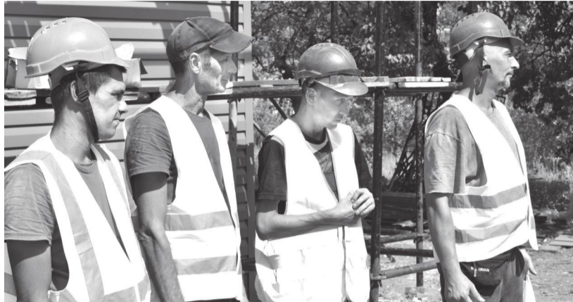
Поздравления принимают строители из региона-шефа, которые выполняют реконструкцию бывшего лечебного корпуса детской больницы

В преддверии Дня строителя поздравления принимали специалисты подрядной организации из региона-шефа, которые выполняют реконструкцию бывшего лечебного корпуса детской больницы.