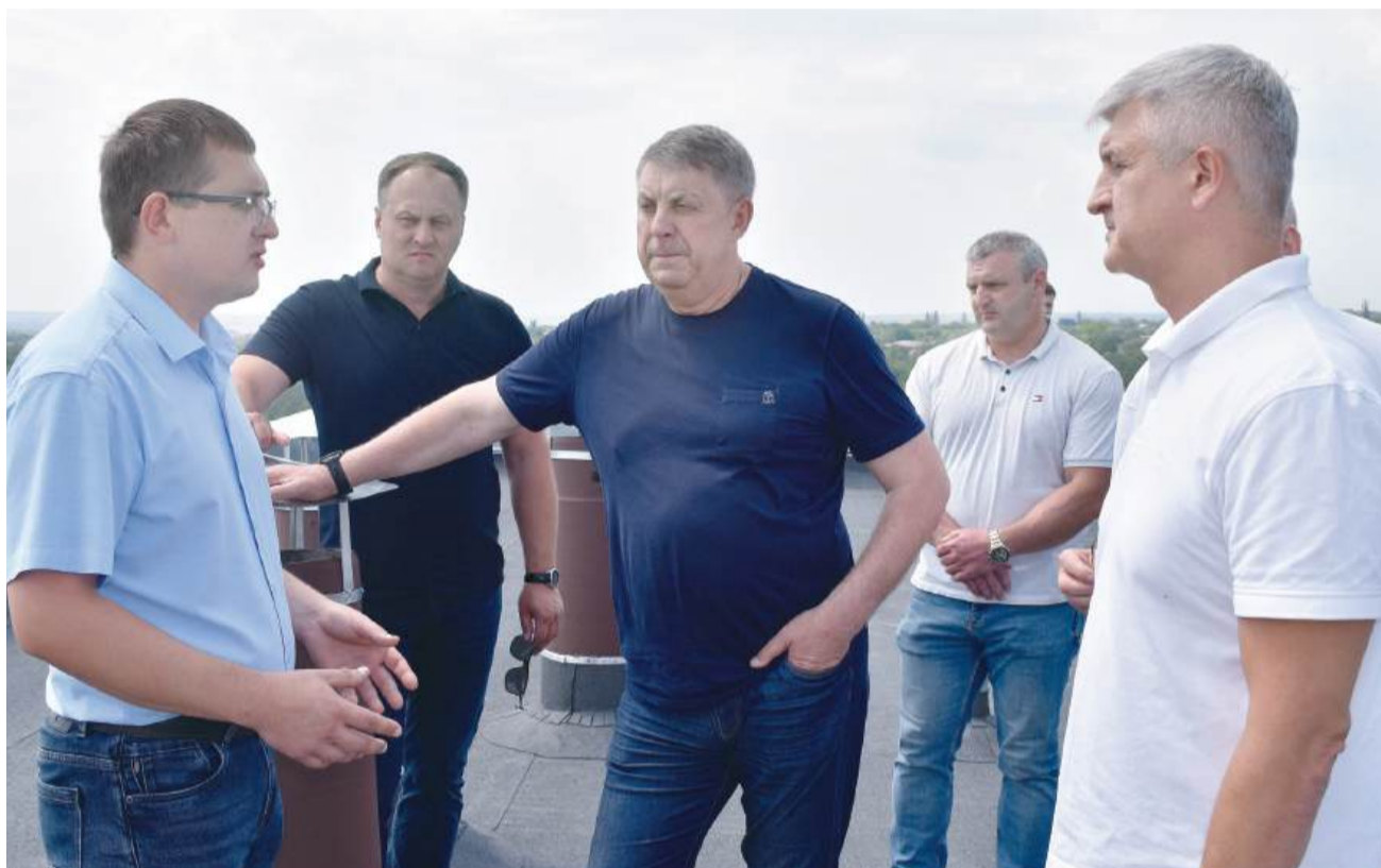
Губернатор Брянской области Александр Богомаз в Брянке