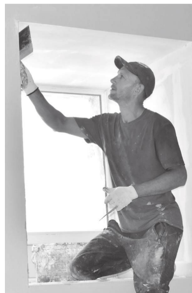
Монтаж откосов в танцклассе Дворца культуры

Подрядчик заверил, что в августе работы на объекте будут завершены.