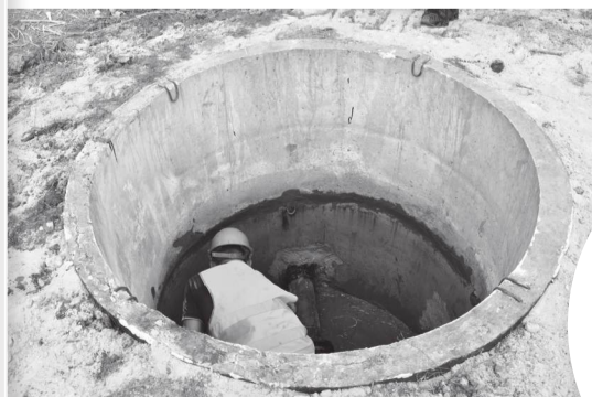
На финишной прямой – реконструкция сетей водоснабжения, идущих от «ВНС «Криворожская» в направлении центральной горбольницы

В дальнейшем под ключ будет произведена отделка помещений. Согласно проектным решениям по перепрофилированию лечебного корпуса под инфекционное отделение подразумевается создание отдельных входов в каждый из 20 боксов. Кроме того, на