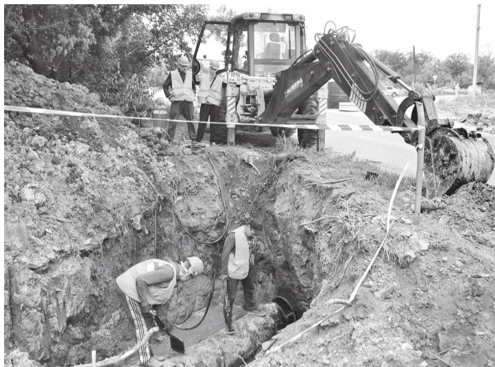
Специалисты из Брянской области ведут замену аварийного участка водовода в районе БИК-11

– Общая протяженность новой трубы диаметром 315 мм составит 1150 метров. По состоянию на 3 июля траншея вырыта полностью, уложено 1100 метров трубы. В завершающем этапе работ задействованы две единицы спецтехники и бригада из четырех человек. После того как труба будет полностью уложена, произведем врезку и будем подключать абонентов, – проинформиро-