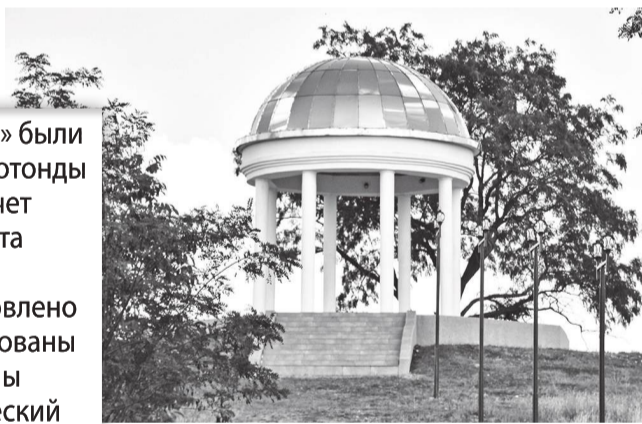
Благодаря симбиозу молодежных идей и поддержки властей Ротонда обрела новый облик

В рамках проекта «Свет Ротонды» были подсвечены колонны, ступени Ротонды и ведущая к ней дорожка. А за счет средств муниципального бюджета установлены опоры наружного освещения вдоль подъема, обновлено покрытие пола Ротонды, оборудованы новые ступени, отремонтированы колонны, произведен косметический ремонт купола.