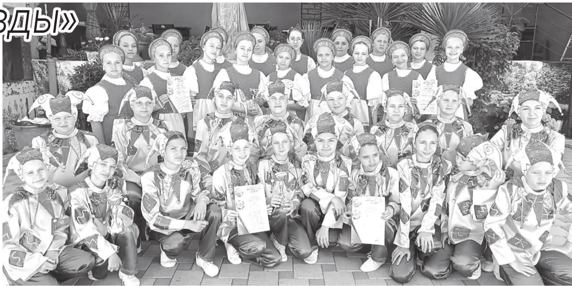
Юные танцоры коллектива «Радость» с призами на конкурсе «Море зажигает звезды», который прошел в поселке Новомихайловское Краснодарского края

– Организаторы конкурса поблагодарили нас за визит и вручили кубки с дипломами. Приятно было услышать, что коллектив у нас очень хороший и дети