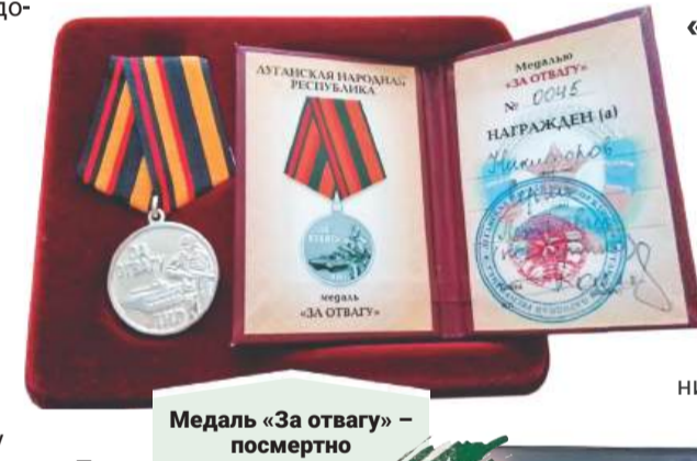
Медаль «За отвагу» – посмертно

Больше двух тысяч осколков попали ему в спину – раны оказались несовместимы с жизнью.