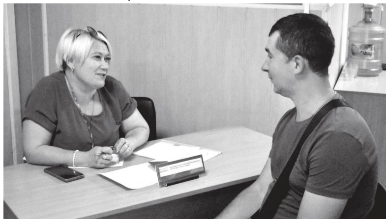
Ярмарка трудоустройства в теротделении ГКУ «Республиканский центр занятости населения ЛНР» в г. Брянке

27 июня в России проходил федеральный этап Всероссийской ярмарки трудоустройства «Работа России. Время возможностей».