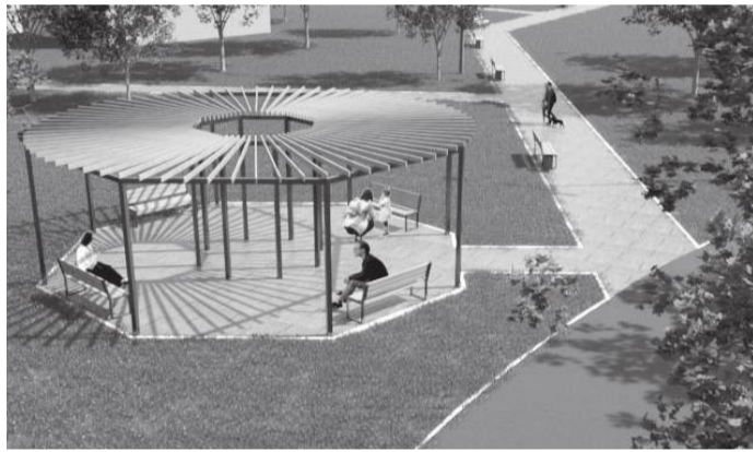
На эскизе из проекта – будущая зона отдыха

Добавлю также, что согласно городской программе ремонта дорог запланирован ремонт дороги, идущей мимо СШ № 9. А контейнерная площадка, расположенная возле дома № 49, будет перенесена в другое место, где коммунальщики оборудуют новое покрытие, подъездные пути, ограждение, установят новые контейнеры и бункер.