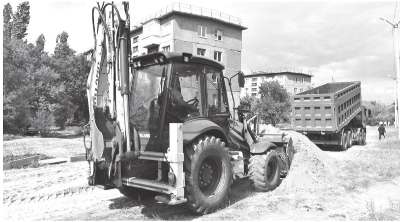
Ведется подготовка основания для аллеи

Кипит работа на аллее, ведущей от СШ № 23 к детсаду «Золотой улей» в микрорайоне № 4, в рамках федерального проекта «Формирование комфортной городской среды» национального проекта «Инфраструктура для жизни».