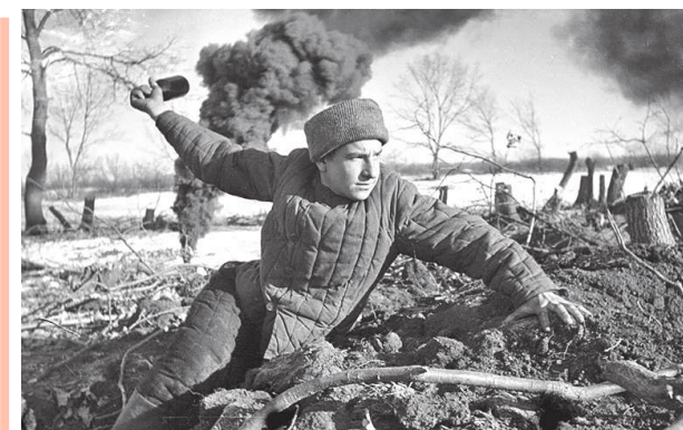
Фотохроника Сталинградской битвы. Сентябрь 1942 года. На подступах к городу. «Стоять насмерть».