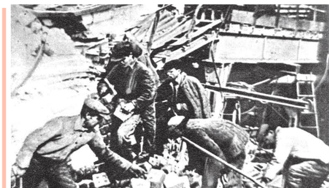
Послевоенное время. Восстановление шахт Донбасса