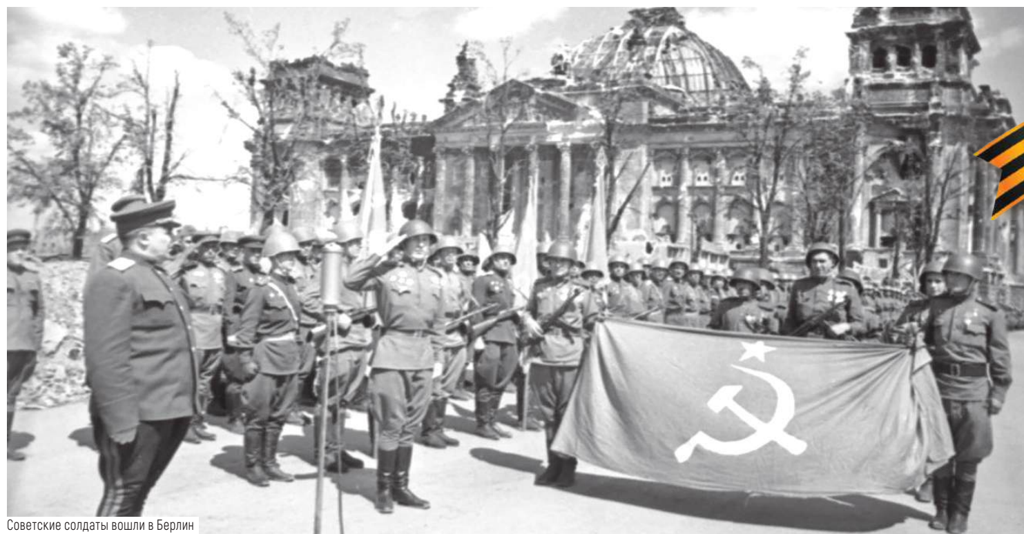
Советские солдаты вошли в Берлин