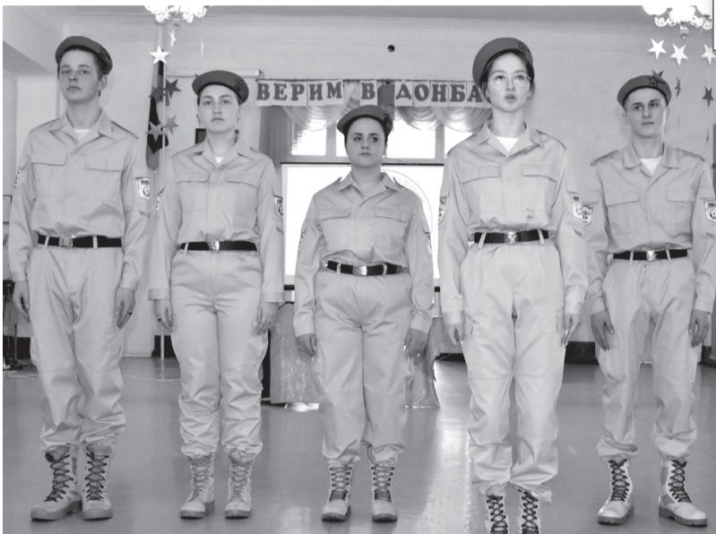
Школьная агитбригада «Патриот» СШ № 4

18 февраля в Брянке прошел IX Антифашистский форум «Верим в Донбасс». Традиционно одна из площадок была организована в криворожской СШ № 4.