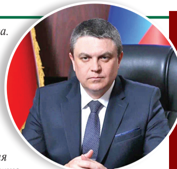
Глава Луганской Народной Республики Леонид ПАСЕЧНИК

Это было тяжелое сражение, победа в котором далась ценой жизней многих наших ребят. Почти все они не были профессиональными военными, но стояли намертво – за свою землю, родные дома, дорогих им людей. Именно мужество и самоотверженность наших земляков стали решающим фактором той очень важной для нас победы. Весь мир тогда понял: мы никогда не отдадим врагу свой Донбасс, нашу родную русскую землю.