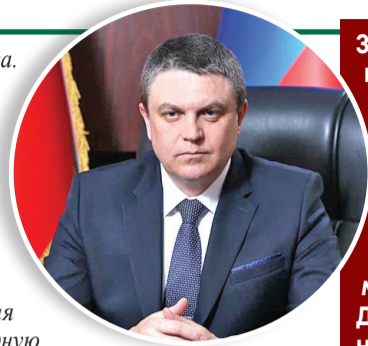
Глава Луганской Народной Республики Леонид ПАСЕЧНИК

Это было тяжелое сражение, победа в котором далась ценой жизней многих наших ребят. Почти все они не были профессиональными военными, но стояли намертво – за свою землю, родные дома, дорогих им людей. Именно мужество и самоотверженность наших земляков стали решающим фактором той очень важной для нас победы. Весь мир тогда понял: мы никогда не отдадим врагу свой Донбасс, нашу родную русскую землю.