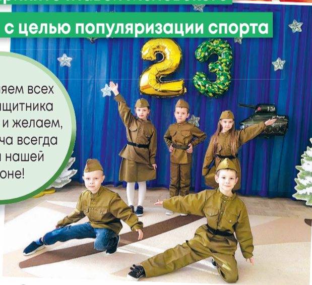
«Воспитанники яслей-сада № 1 «Ласточка»

Поздравляем всех с Днем защитника Отечества и желаем, чтобы удача всегда была на нашей стороне!