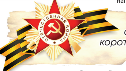
Светлана Склярова, по материалам музея «Молодая гвардия».

Говорят, что жизнь измеряется не годами, а делами. Братьям Хибаловым судьба отмерила короткий век, но они успели главное – спасти Родину от жестокого и беспощадного врага.