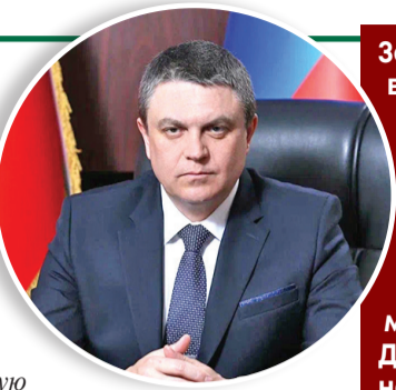
Глава Луганской Народной Республики Леонид ПАСЕЧНИК

18 февраля навсегда стало одной из самых важных дат в новейшей истории Донбасса. Десять лет назад была победоносно завершена Чернухино-Дебальцевская операция, переломившая ход нашего противостояния украинской агрессии. Объединенные вооруженные силы Луганской и Донецкой Народных Республик, несмотря на серьезное превосходство противника в живой силе и технике, полностью разгромили врага, вынудив его бегством спасаться из дебальцевского котла. Это было тяжелое сражение, победа в котором далась ценой жизней многих наших ребят. Почти все они не были профессиональными военными, но стояли намертво – за свою землю, родные дома, дорогих им людей. Именно мужество и самоотверженность наших земляков стали решающим фактором той очень важной для нас победы. Весь мир тогда понял: мы никогда не отдадим врагу свой Донбасс, нашу родную русскую землю.