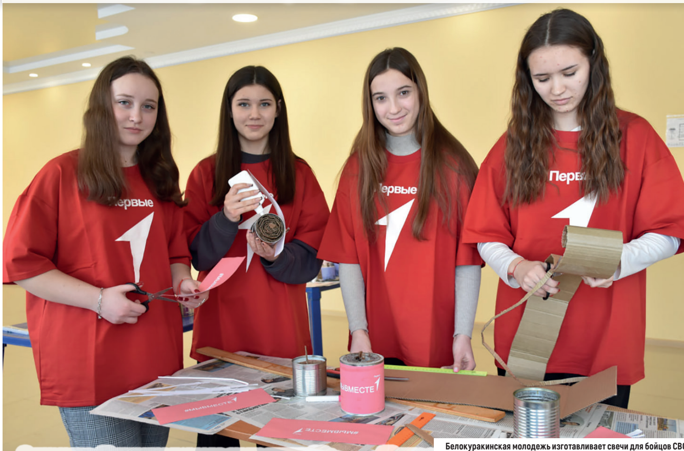
Белокуракинская молодежь изготавливает свечи для бойцов СВО

В преддверии Дня защитника Отечества в белокуракинском Доме культуры состоялась всенародная акция «Окопная свеча», организованная Администрацией округа совместно с местным отделением партии «Единая Россия».