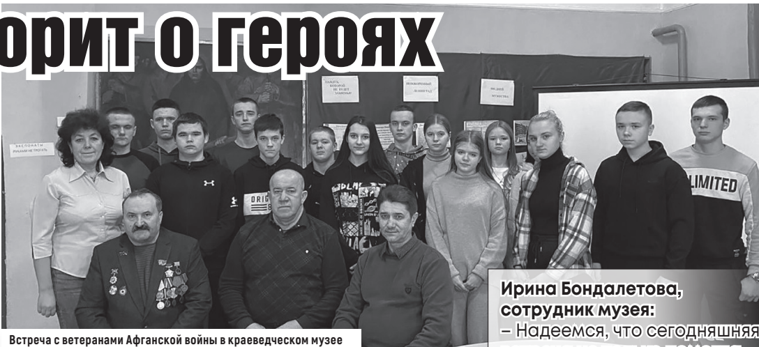
Встреча с ветеранами Афганской войны в краеведческом музее