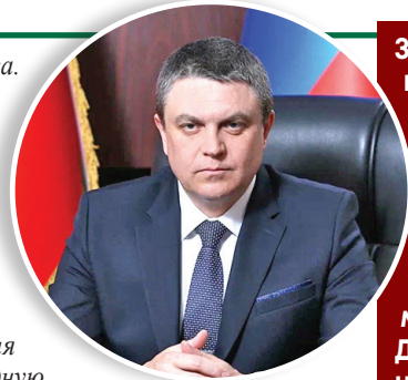
Глава Луганской Народной Республики Леонид ПАСЕЧНИК

Это было тяжелое сражение, победа в котором далась ценой жизней многих наших ребят. Почти все они не были профессиональными военными, но стояли намертво – за свою землю, родные дома, дорогих им людей. Именно мужество и самоотверженность наших земляков стали решающим фактором той очень важной для нас победы. Весь мир тогда понял: мы никогда не отдадим врагу свой Донбасс, нашу родную русскую землю.