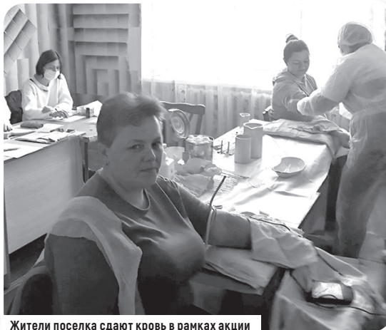
Жители поселка сдают кровь в рамках акции

Белокуракинское местное отделение Всероссийской политической партии «Единая Россия» накануне Дня защитника Отечества организовало массовую сдачу крови для участников специальной военной операции.