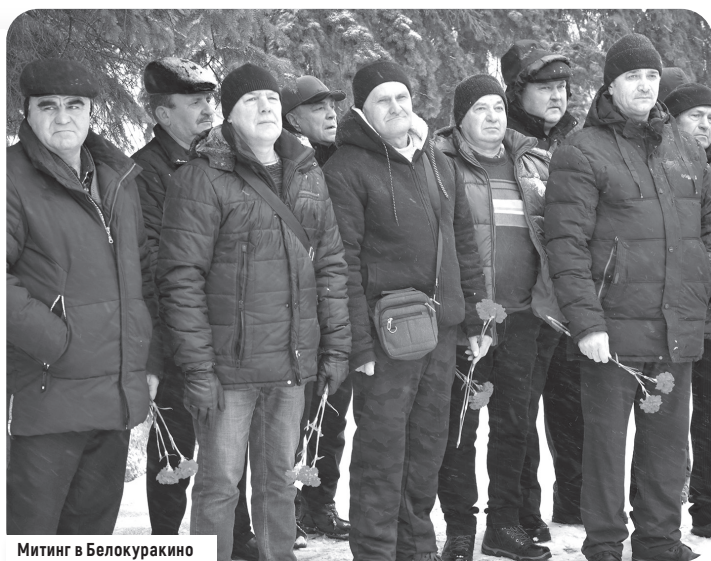
Митинг в Белокуракино