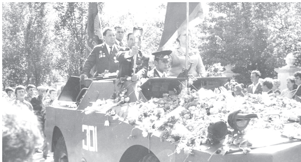
› День 30-летия Победы в Великой Отечественной войне