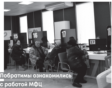
Побратимы ознакомились с работой МФЦ