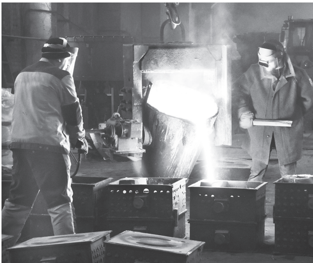
В литейном цеху Брянковского машзавода

Невзирая на трудности военного времени, предприятие удержалось на плаву. Более того, были освоены капитальный ремонт и выпуск породопогрузочных машин, проходческих и очистных комбайнов, лебедок, скребковых и ленточных конвейеров. Сегодня 90 % продукции завода – это запчасти к данному горно-шахтному оборудованию.