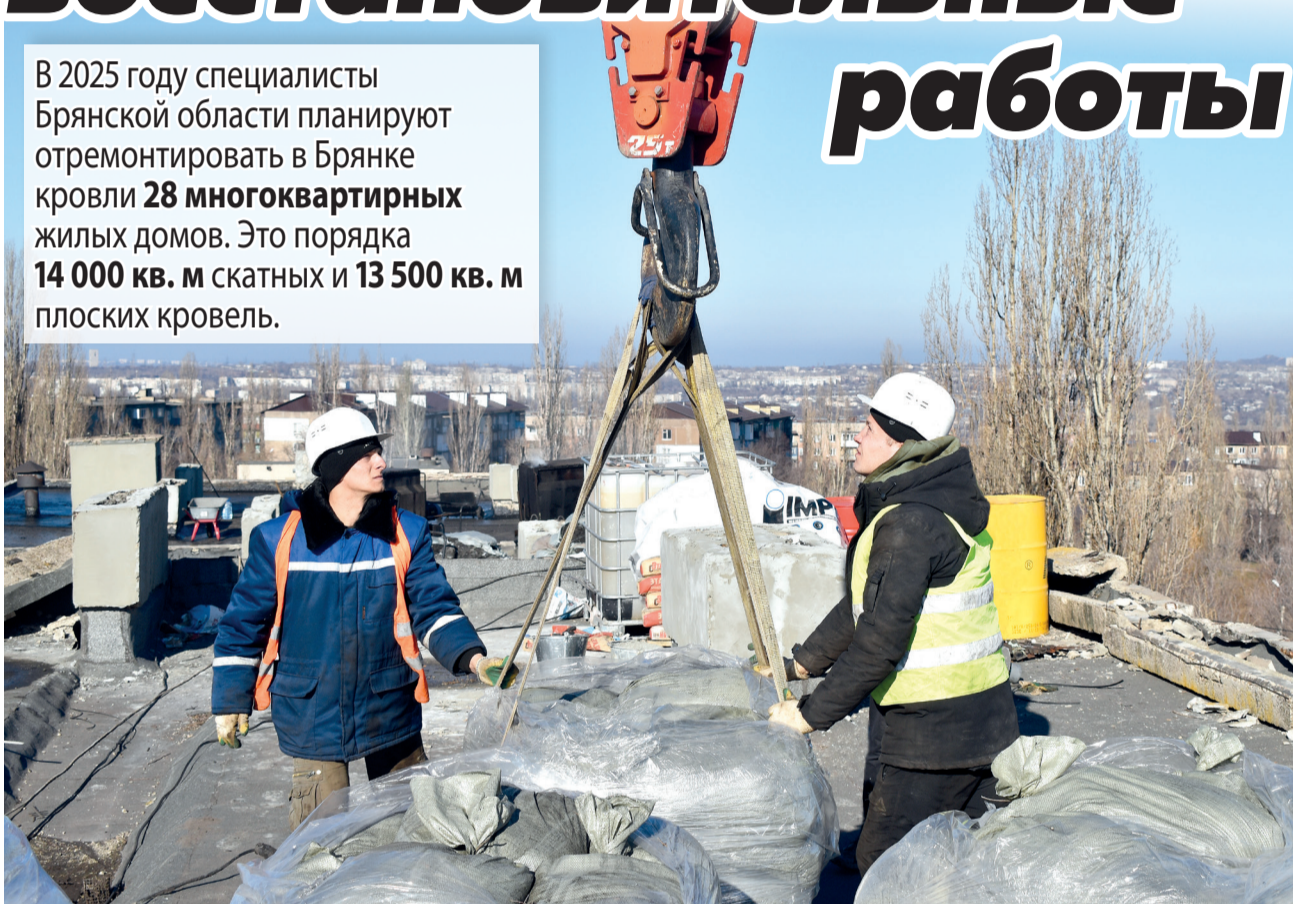
Специалисты Брянской области приступили к капремонту кровли дома № 33 в микрорайоне № 4

В 2025 году специалисты Брянской области планируют отремонтировать в Брянке кровли 28 многоквартирных жилых домов . Это порядка 14 000 кв. м скатных и 13 500 кв. м плоских кровель.