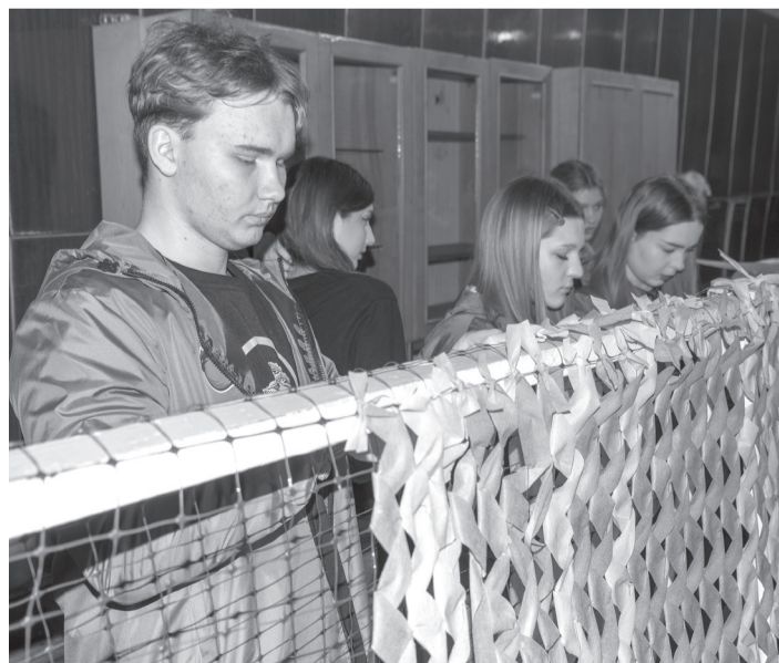
Волонтеры Брянки изготавливают маскировочные сети для бойцов на передовой

В городском Центре по развитию добровольчества в рамках очередного этапа патриотического проекта «СВОими руками» прошел мастер-класс по изготовлению маскировочных сетей и блиндажных свечей для солдат, принимающих участие в боевых действиях.