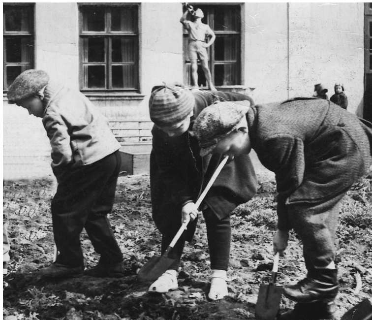
Воспитанники детсада «Дубок» на приусадебном участке

Малыши всех возрастов выращивают на грядках лук, редис, помидоры, огурцы, капусту. Ухаживают за цветами, взрыхляют землю, вырывают сорную траву, поливают. Дети любят трудиться, а главное – видеть результаты своего труда. Хорошо организованный и выполненный труд приучает детей к порядку.