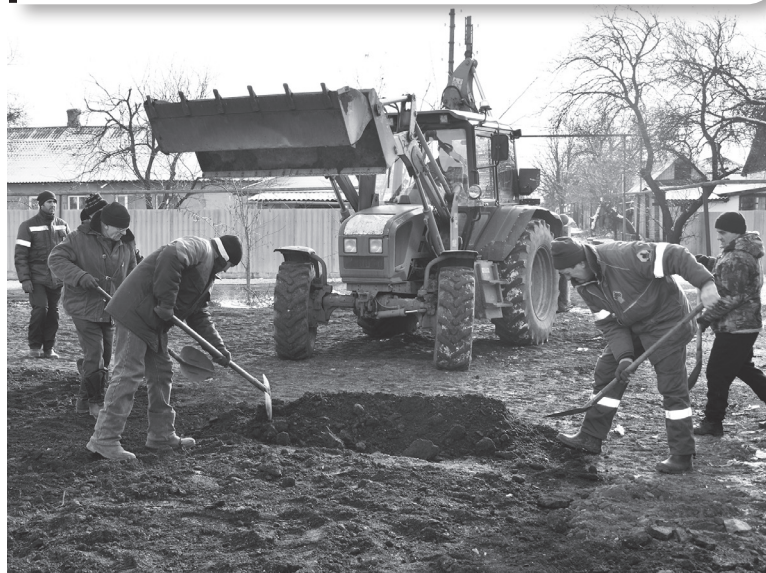
Благоустройство контейнерной площадки в районе 110-го магазина

Благоустраиваются контейнерные площадки, расположенные в районе автобусной остановки «Верхнее микро», на бывшей парковке возле дома № 1 в микрорайоне Тополь, в районе магазина «Тополек», дома № 43 в микрорайоне Тополь-2, 110-го магазина.