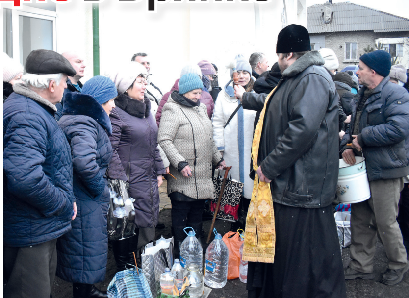
Обряд освящения в Свято-Николаевском храме

На Крещение служба в храме всегда заканчивается Великим освящением воды. В этот день каждый брянковчанин несет домой святую, которую будет употреблять во время искушения, болезни. – Вначале нужно понести молитву, а затем принять небольшую часть воды – глоток. Хранить освященную