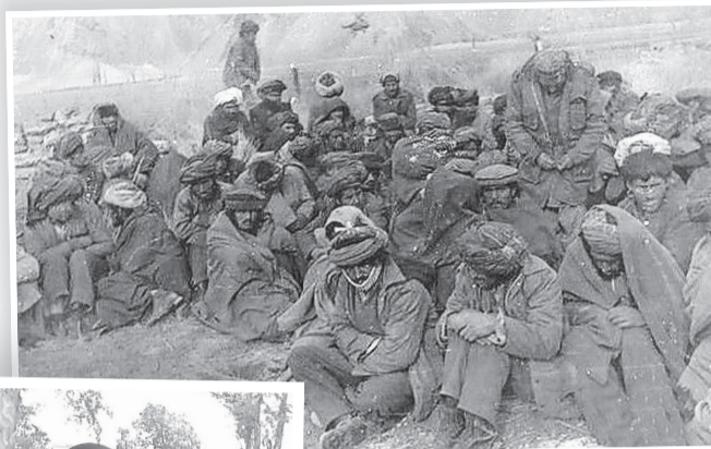
«Они расстреляли Панфиловскую заставу»