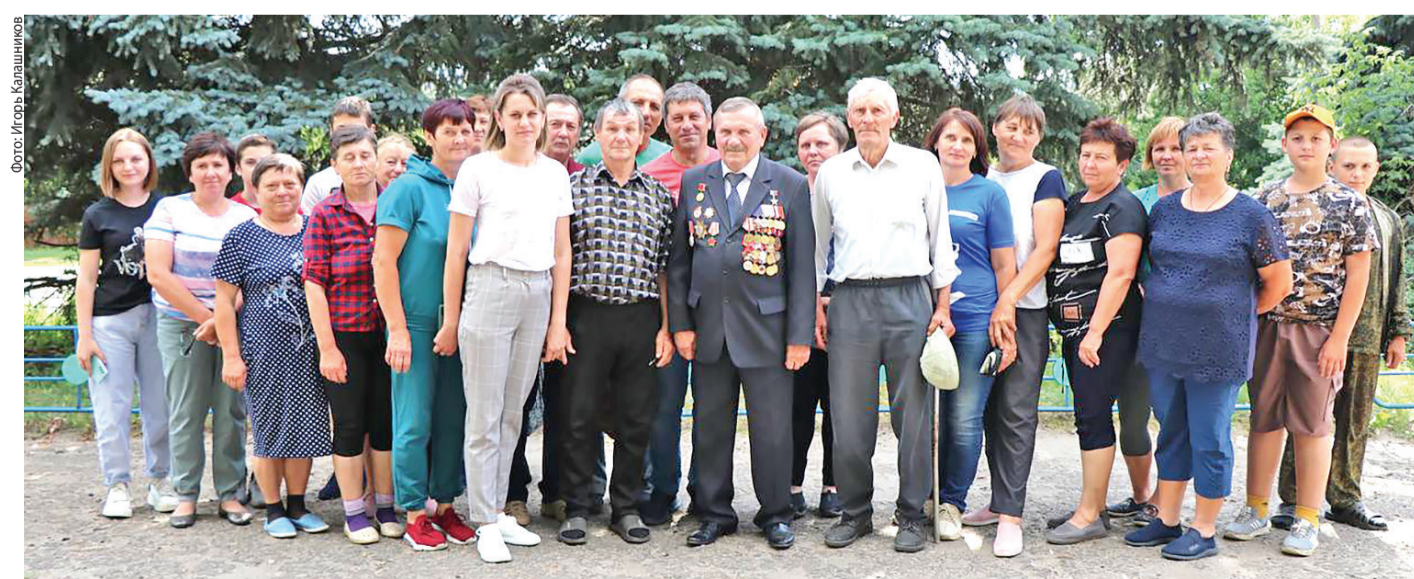
Встреча с земляками в 2023 году