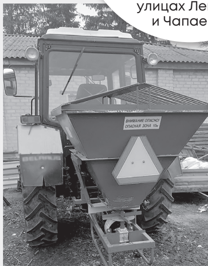
Новый разбрасыватель песка модели Л-116-01

В данный момент активно осуществляются работы по посыпке дорог песком на территории Белокуракинского округа. В этом году предприятие приобрело современные разбрасыватели песка модели Л-116-01, которые обеспечивают