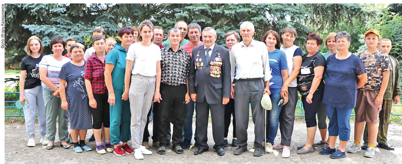
Встреча с земляками в 2023 году