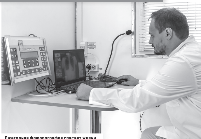
Ежегодная флюорография спасает жизни

Замена колбасы, сосисок, бекона и других мясопродуктов в рационе на обычное нежирное мясо сокращает риск возникновения рака кишечника на 20 процентов. Снижение потребления переработанного мяса до 70 г в неделю уже позволяет уменьшить риск возникновения рака на 10 процентов.