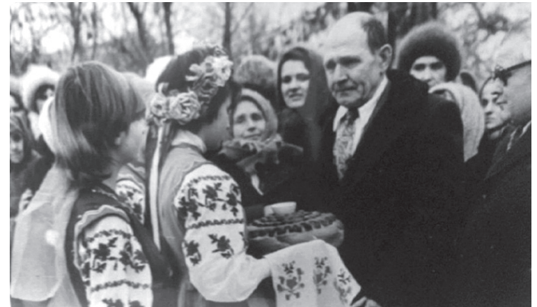
Хлеб-соль для ветерана-освободителя

Отгремели сражения, смолкли рев орудий и стрекот автоматов. Вчерашние солдаты вернулись домой. Перед ними стояли новые задачи – поднимать страну из руин и налаживать мирную жизнь.