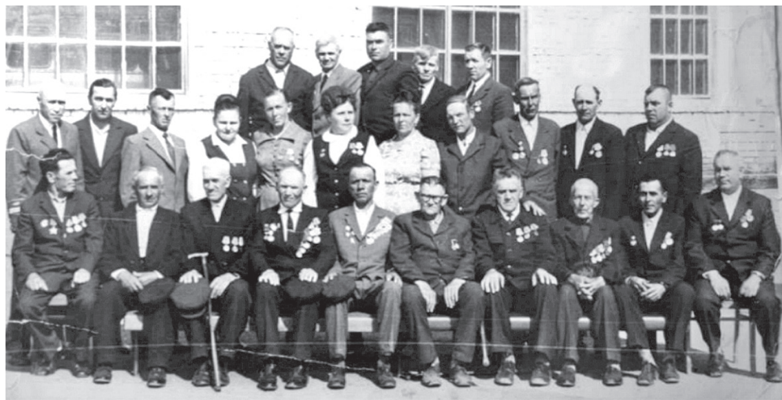
Ветераны 172-й стрелковой дивизии