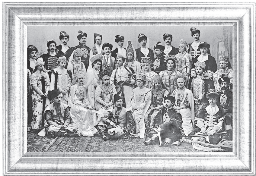
► Портреты участников костюмированного бала 1903 года

не из золотой парчи и царской шапке. Императрица Александра Федоровна была в образе царицы Марии Ильиничны. В древнерусские костюмы облачились даже музыканты оркестра.