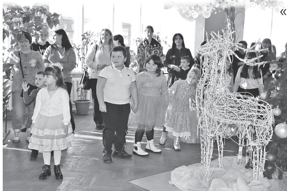
► Ребята смотрели выступление сибиряков в ДК им. Свердлова с интересом