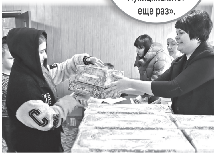
► Лучший подарок – новогоднее настроение!

«Проделанной работой мы довольны, и надеемся, что приедем в Свердловский муниципалитет еще раз».