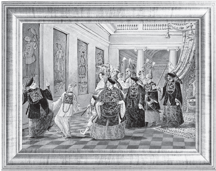
► Николай Беккер. Придворный маскарад в Аничковом дворце