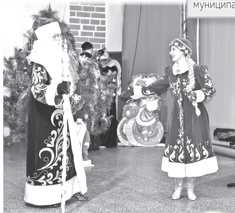
► Красноярские Дед Мороз и Снегурочка подарили нашей детворе незабываемый праздник

В Володарском поселковом клубе, на сцене, где была установлена наряженная елка, сибиряки выступили для детей из семей погибших участников специальной военной операции.