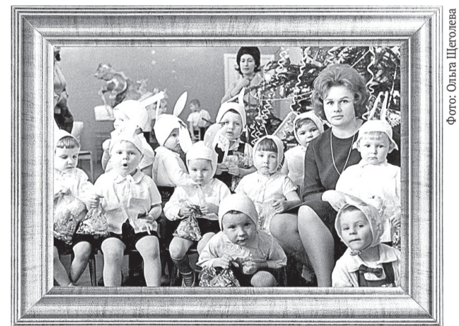
► Детвора в костюмах зайчиков. Новый год в детском саду, 1968 год

Важным элементом многих костюмов были маски в ви-