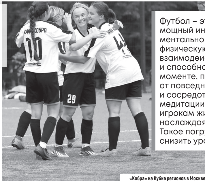
«Кобра» на Кубке регионов в Москве