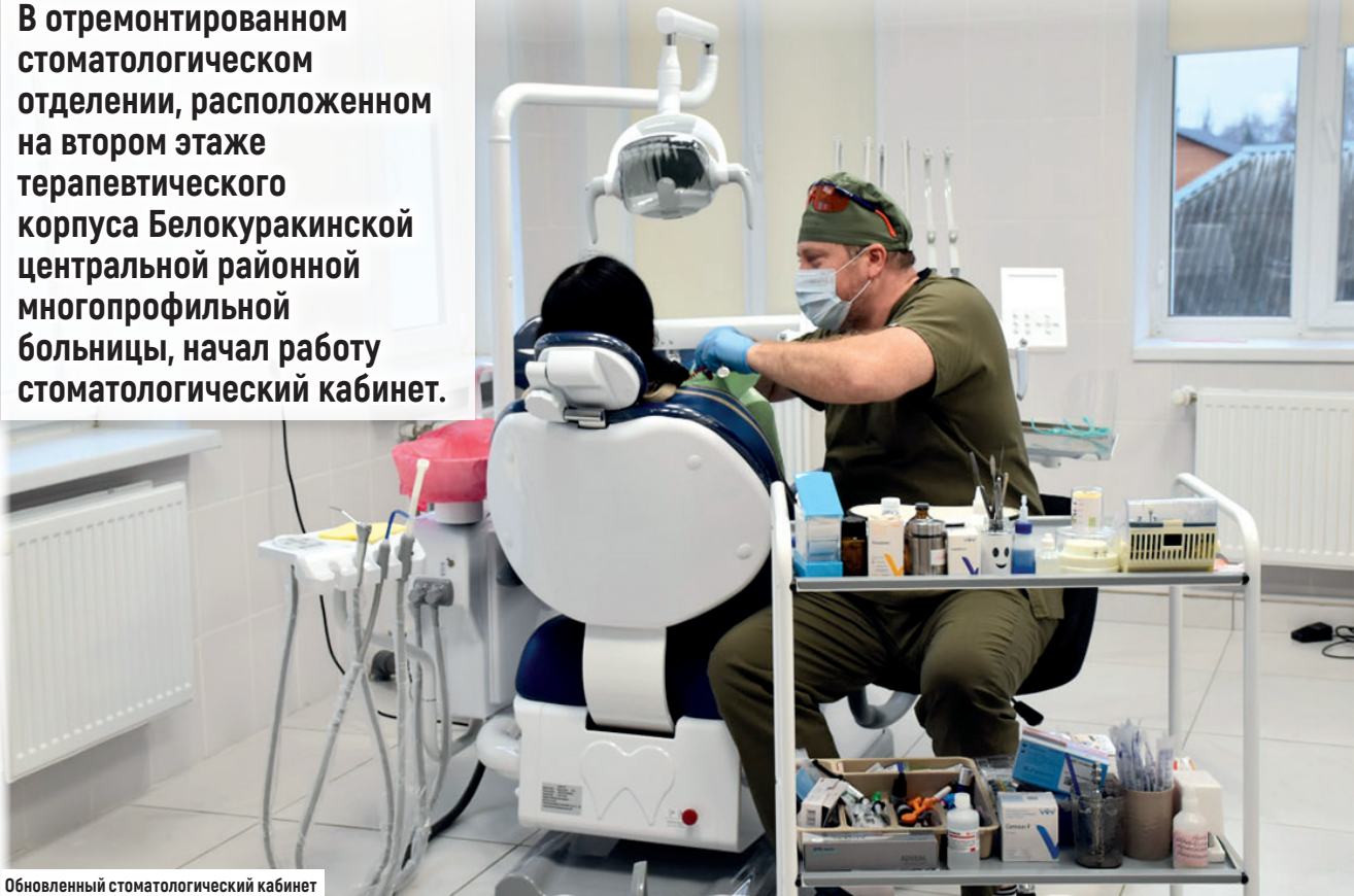
Обновленный стоматологический кабинет

В отремонтированном стоматологическом отделении, расположенном на втором этаже терапевтического корпуса Белокуракинской центральной районной многопрофильной больницы, начал работу стоматологический кабинет.