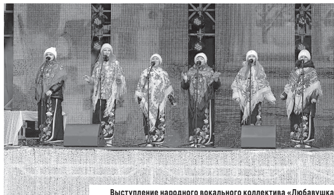
Выступление народного вокального коллектива «Любавушка»