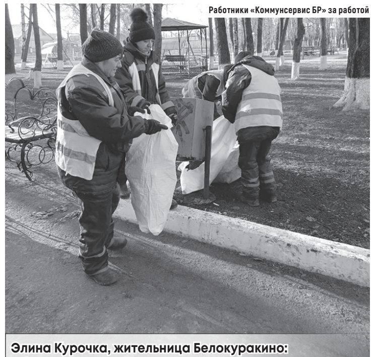
Работники «Коммунсервис БР» за работой

По ее словам, коммунальной службой также был организован вывоз твердых коммунальных отходов с территории округа.