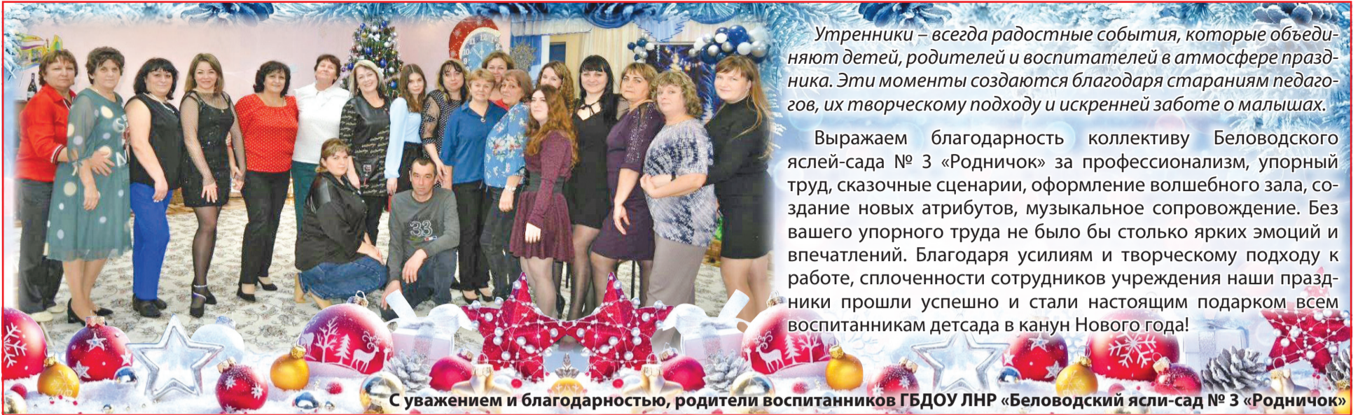
С уважением и благодарностью, родители воспитанников ГБДОУ ЛНР «Беловодский ясли-сад № 3 «Родничок»

Утренники – всегда радостные события, которые объединяют детей, родителей и воспитателей в атмосфере праздника. Эти моменты создаются благодаря стараниям педагогов, их творческому подходу и искренней заботе о малышах.