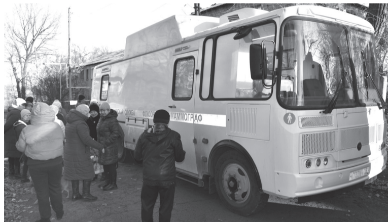
Передвижной комплекс «Флюомам» в Замковке

В ответ на обращения жителей Замковки в поликлинику № 5, к которой они прикреплены, была организована выездная работа мобильного фельдшерско-акушерского пункта и передвижного комплекса «Флюомам» центральной горбольницы.