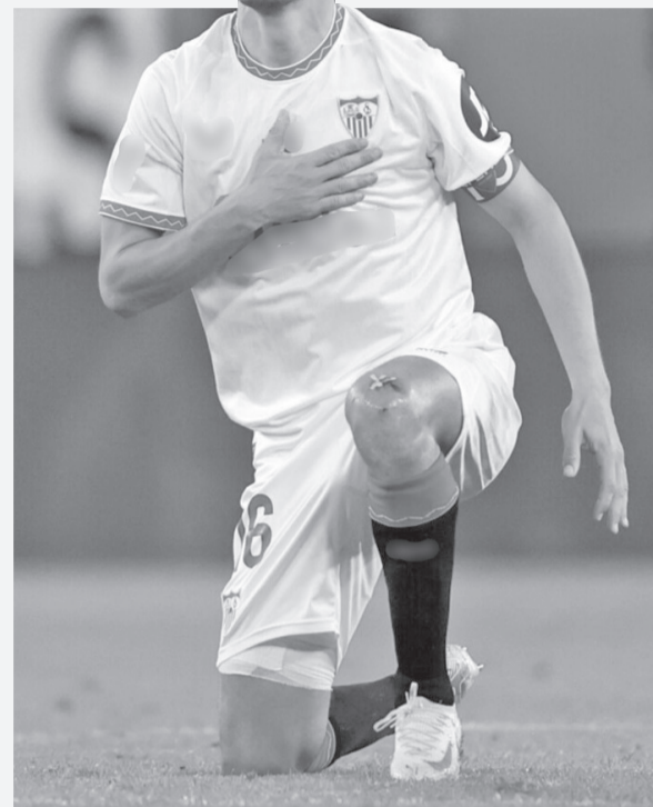
Игрок останется в клубе и займет административную должность.

18 июня 2023 года Навас сыграл за сборную Испании в возрасте 37 лет и 209 дней, установив рекорд сборной как самый возрастной футболист, вышедший на поле. В 2023 году стал первым футболистом в истории, выигравшим чемпионат мира, чемпионат Европы и Лигу наций УЕФА.