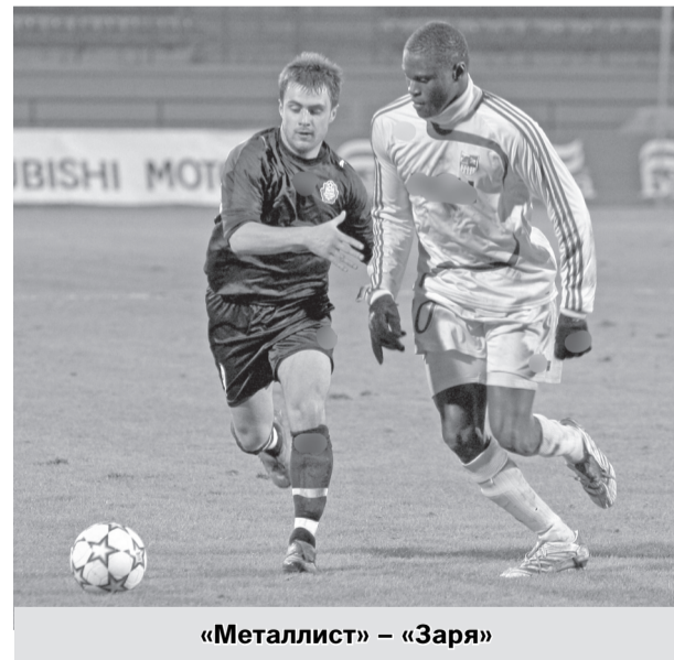
«Металлист» – «Заря»

Один мяч в свои ворота забил Артем Милевский «Динамо» (Киев).