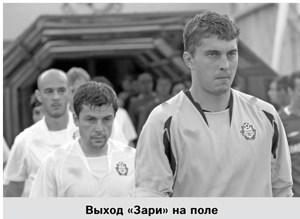
Выход «Зари» на поле

Далее наступил спад, команда проиграла подряд четыре матча, не забив при этом ни одного мяча, и опустилась в опасную зону. Если в Одессе луганчане как-то боролись и в упорной борьбе уступили, а в домашнем матче с днепропетровским «Днепром» дали настоящий бой лидеру, что тот еле ноги унес, то в играх с командами равного уровня – львовскими «Карпатами»