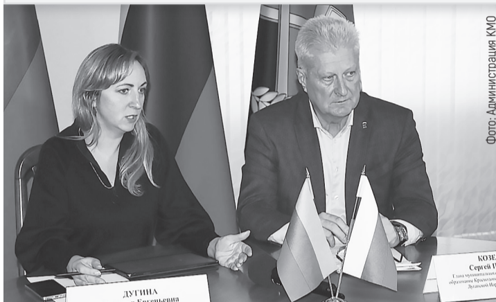
Фото: Администрация КМО

На прошлой неделе в Администрации Краснодонского муниципального округа прошли рабочие встречи с представителями министерств республики. Говорили о перспективах развития территории, обсуждали реальные шаги по созданию достойных условий жизни и труда граждан.