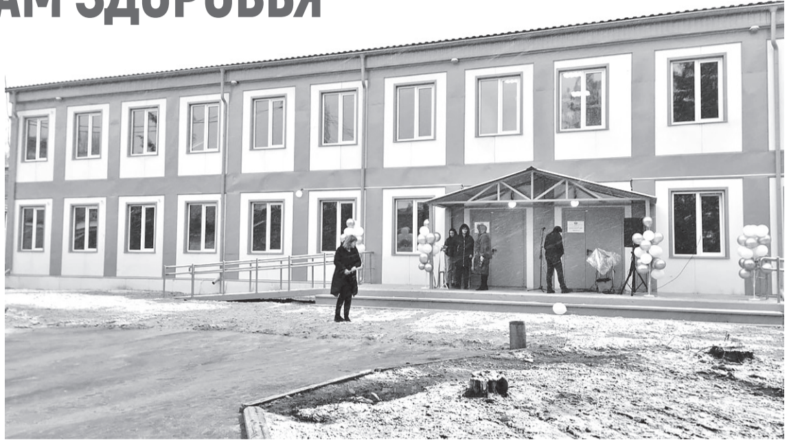
Общий вид нового здания Сватовской центральной районной многопрофильной больницы

Как известно, Сватовская центральная районная многопрофильная больница неоднократно подвергалась ракетным атакам со стороны ВСУ. В результате одной из них было разрушено здание терапевтического отделения, а также пункта по переливанию крови. На помощь пришли шефы из Саратовской области. На протяжении нескольких месяцев бригада саратовцев вела работы по возведению модульного корпуса, а потом и по монтажу систем водо- и теплообеспечения, внутреннему обустройству помещений. Вместе с ней в выполнении работ принимали участие и трудовые коллективы Сватово, работники больницы.