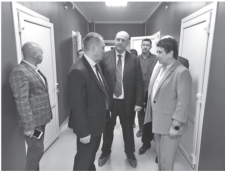
При осмотре новых кабинетов больницы обсуждались деловые вопросы