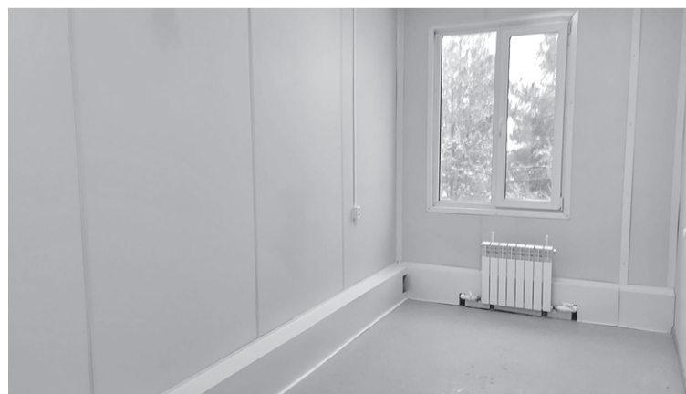
В одном из кабинетов нового корпуса больницы

Была перерезана красная ленточка – как символ сдачи нового здания в эксплуатацию. Все присутствующие смогли пройти по кабинетам корпуса, убедиться в высоком качестве выполненных работ. Пока в этих кабинетах отсутствует мебель, но, как сказано выше, скоро ее доставят.