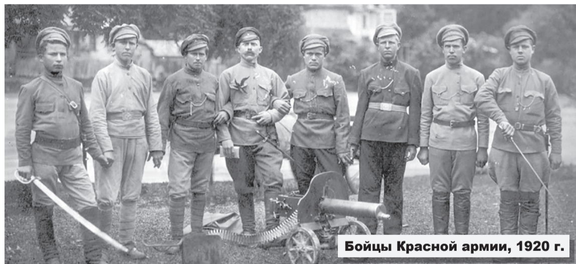
Бойцы Красной армии, 1920 г.