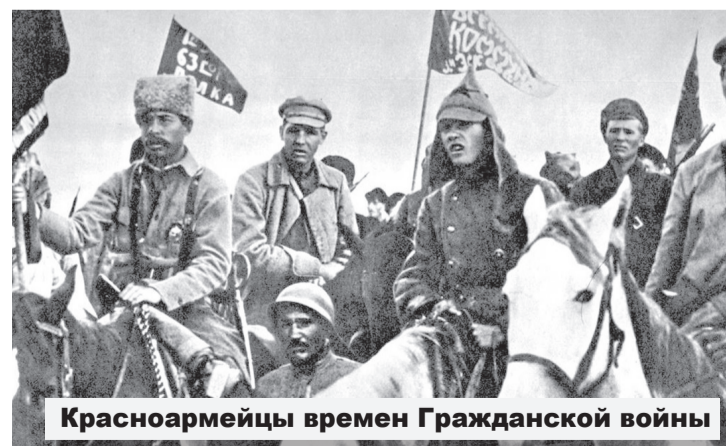
Красноармейцы времен Гражданской войны

Дмитрий Николаевич Медведев родился в 1898 году в рабочей семье в слободе Бежица близ Брянска. Учился в гимназии, а с 1917 года окунулся в революционное движение. Сначала трудился в профсоюзных и советских органах, затем в составе подразделений Красной армии воевал на фронтах Гражданской войны. С мая 1920 года работал сначала в Брянской ЧК, затем в Донецкой губернской чрезвычайной комиссии, а с марта 1921-го по август 1922 года возглавлял Старобельскую УЧК. Далее работал в органах госбезопасности, а в годы Великой Отечественной войны внес огромный вклад в организацию партизанского движения.