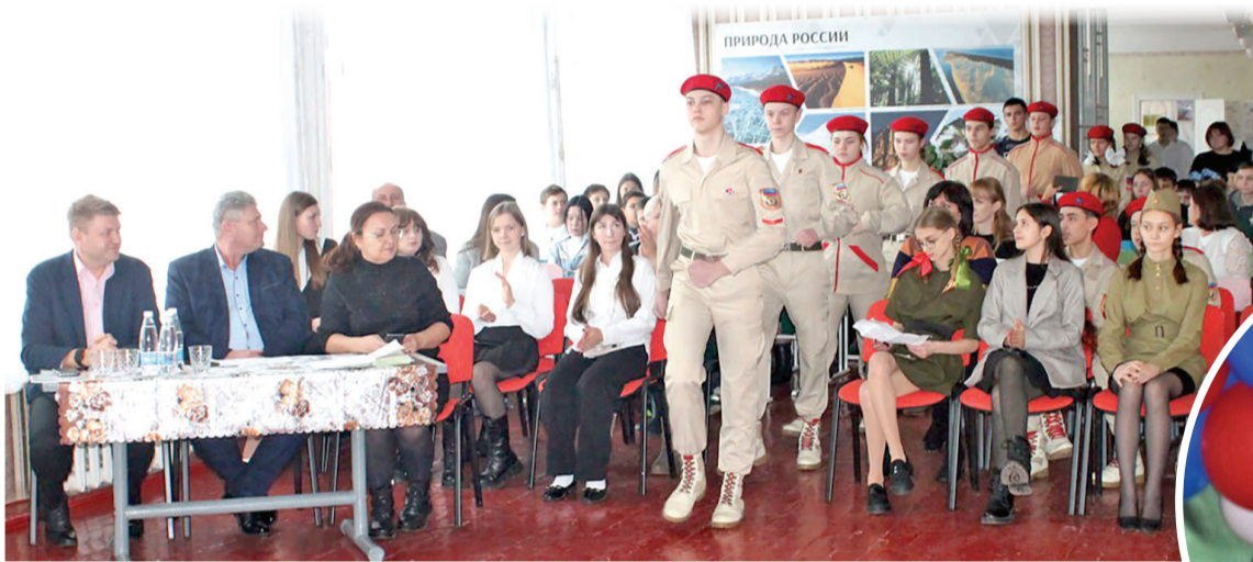
Юнармейцы Меловской средней школы приветствуют участников конкурса

Прошел конкурс юных чтецов общеобразовательных учреждений Меловщины, в ходе которого ребята показали хорошее владение словом.