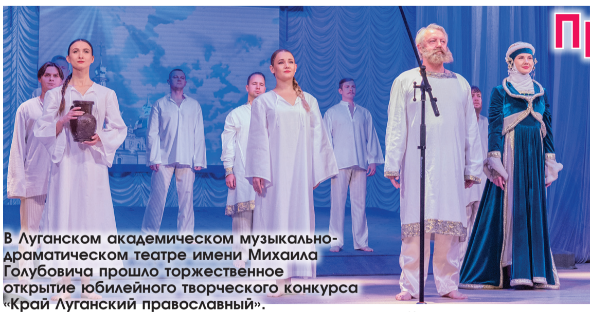
В Луганском академическом музыкально-драматическом театре имени Михаила Голубовича прошло торжественное открытие юбилейного творческого конкурса «Край Луганский православный».

По всем вопросам обращаться +7 959 269-36-70.