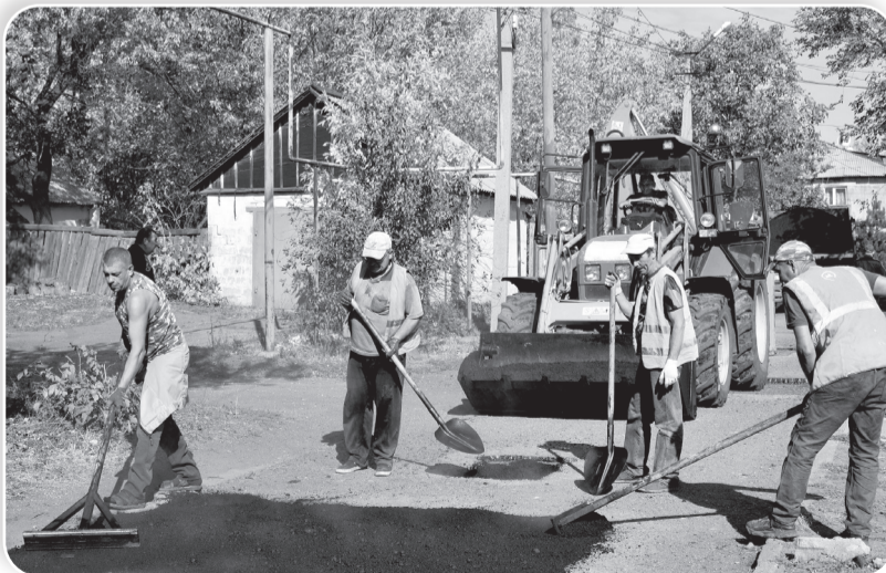
Ямочный ремонт дороги в переулке Горького

– Отремонтирован участок, который можно сделать ямочным способом. Там, где необхо-