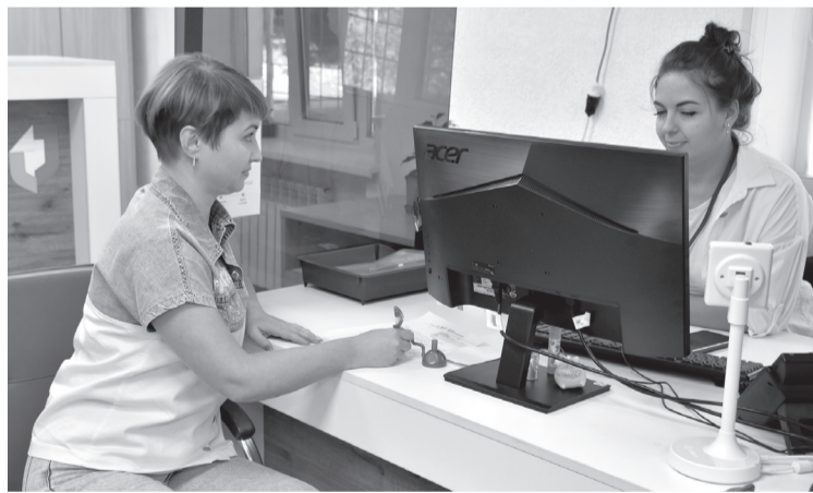
В ТОСП г. Брянки

вторник, среда, пятница – с 08:00 до 18:00, без перерыва; четверг – с 09:00 до 17:00, без перерыва; суббота – с 08:00 до 17:00, без перерыва; понедельник, воскресенье – выходные дни.