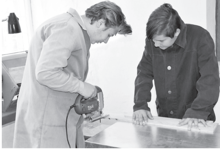
Урок труда в мастерской УВК № 17

В этом учебном году в российские школы вернулись уроки труда. Причем без обязательного деления на мальчиков и девочек, как раньше, данный вопрос – на усмотрение родителей и школы.