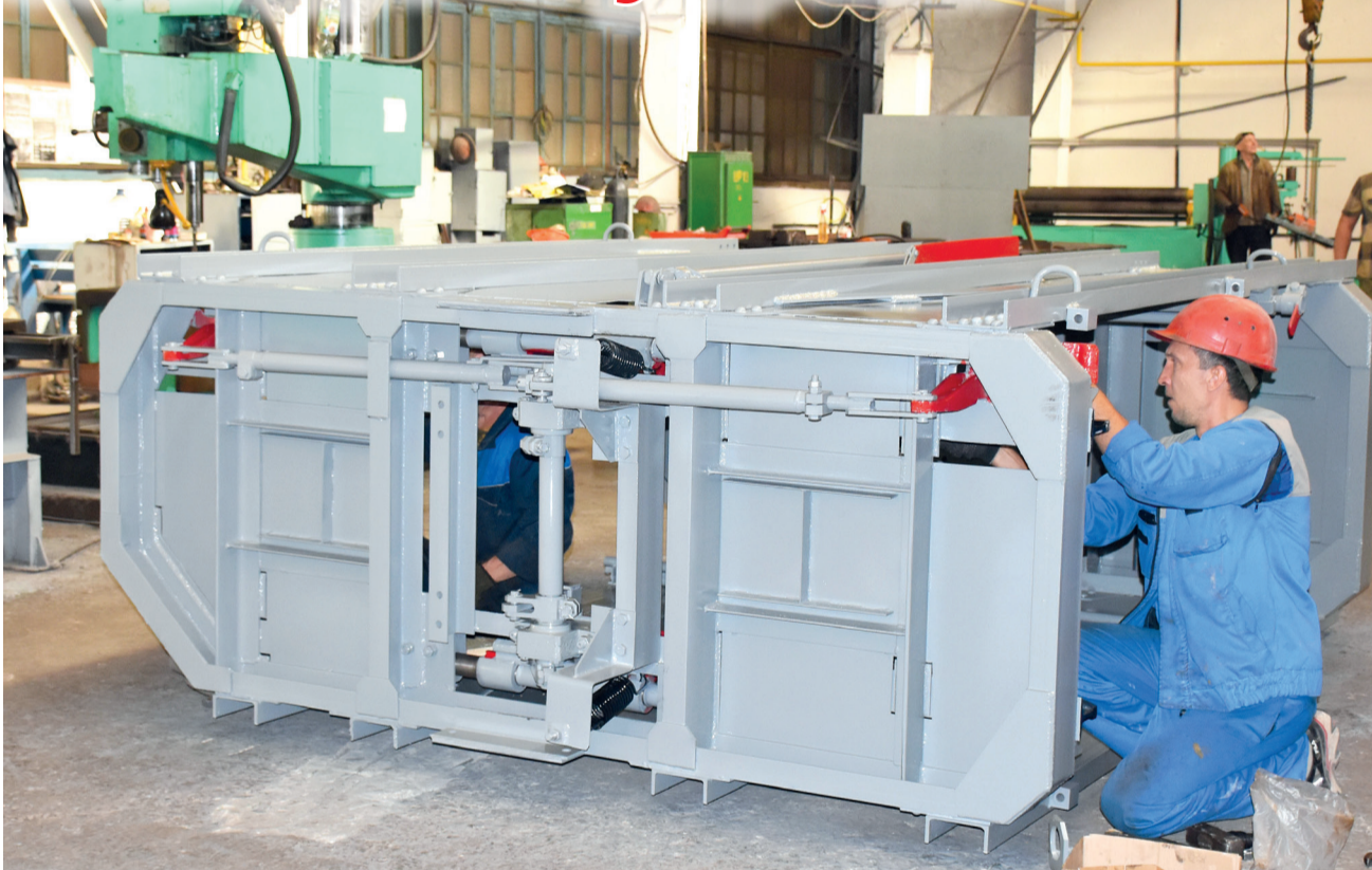
Сборка шахтной клетки