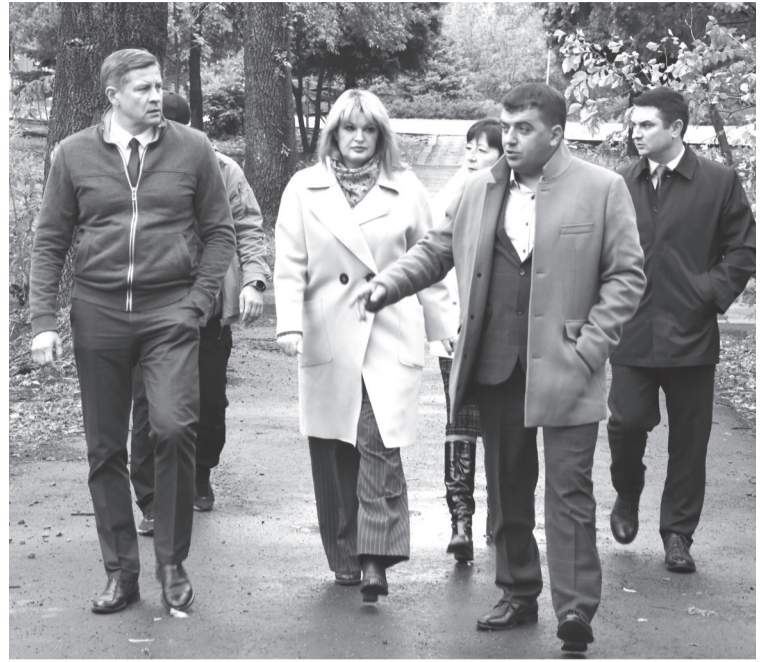
Рабочий визит Председателя Правительства ЛНР в парк «Горняк»

Председатель Правительства ЛНР подчеркнул, что, учитывая масштабы производства, потребуется поддержка республиканского и федерального уровней. Также он отметил заинтересованность руководства в привлечении рабочей