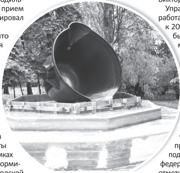
Арт-объект металлургического кокса в парке «Горняк»