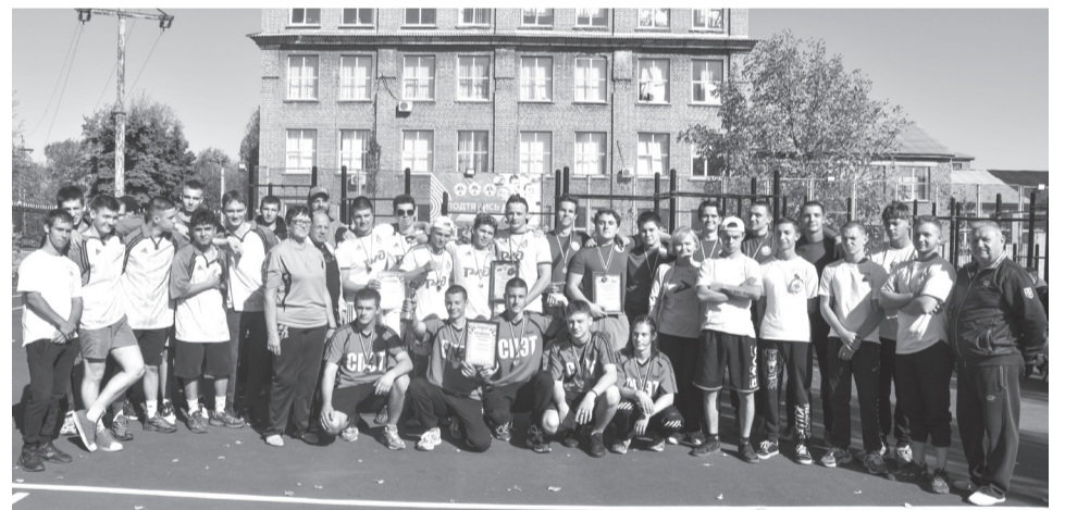
Счастливые участники спортивного батла после награждения

На стахановском стадионе «Победа» прошел спортивный батл среди студентов «Осенний вернисаж», приуроченный ко Дню туризма. Мероприятие стало уже традиционным и проводится ежегодно. В нем приняли участие студенты средних специальных и высших учебных заведений города.