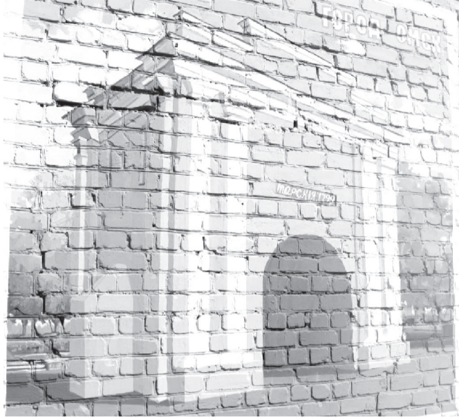
фото: Администрация г. Стаханова

Регион-шеф Омская область в этом году выполнил ремонт 13 трансформаторных подстанций, расположенных на территории города. Во время выполнения восстановительных работ у руководителей региона возникла идея превратить ТП в арт-объекты.