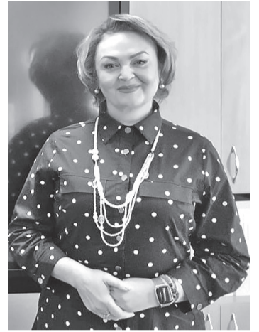
Заместитель директора по учебно-воспитательной работе

Недалеко от гимназии находится школа искусств, и немало наших уче-