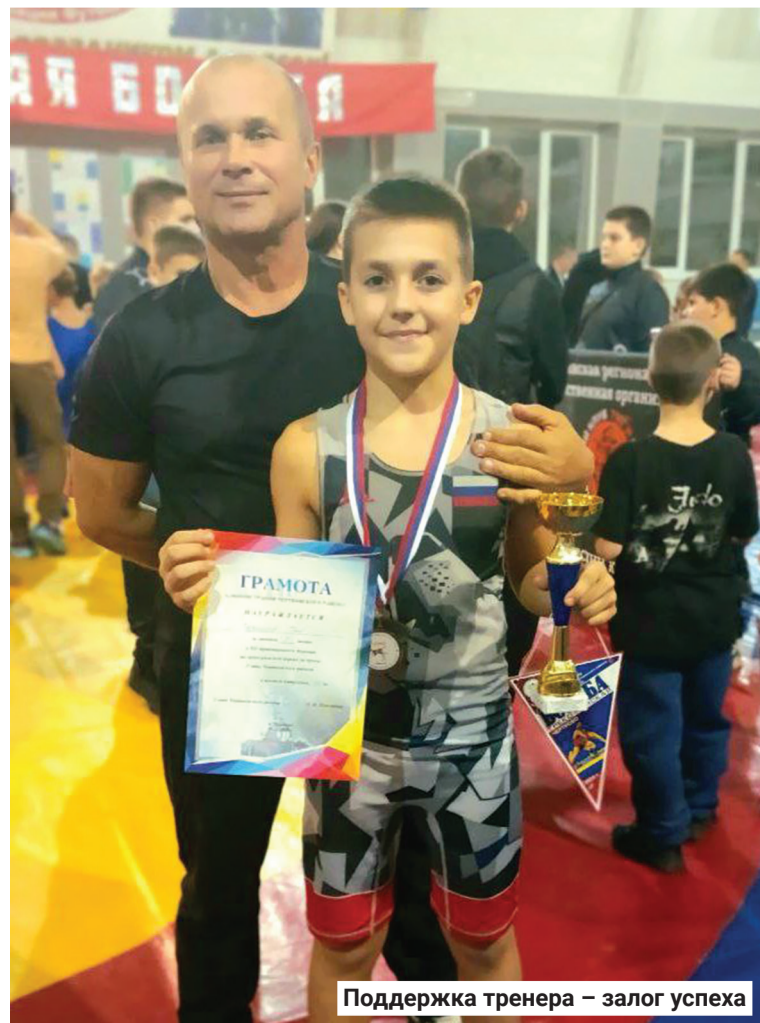
Поддержка тренера – залог успеха