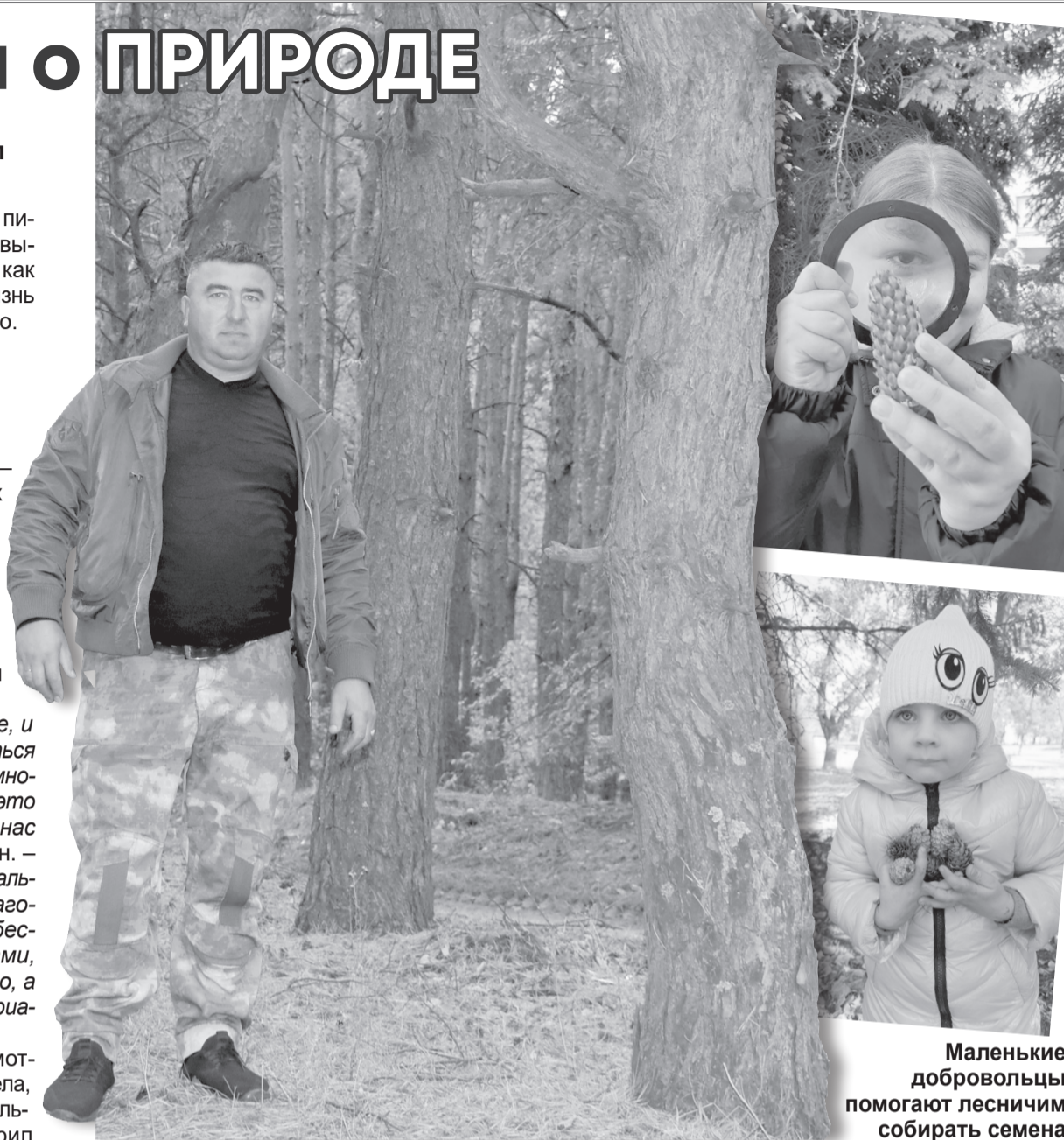
Маленькие добровольцы помогают лесничим собирать семена

За молодыми деревьями обязательно нужен уход. Он включает в себя регулярный полив, защиту от вредителей и болезней. Только при должном внимании и заботе мы сможем создать здоровый и красивый лес.