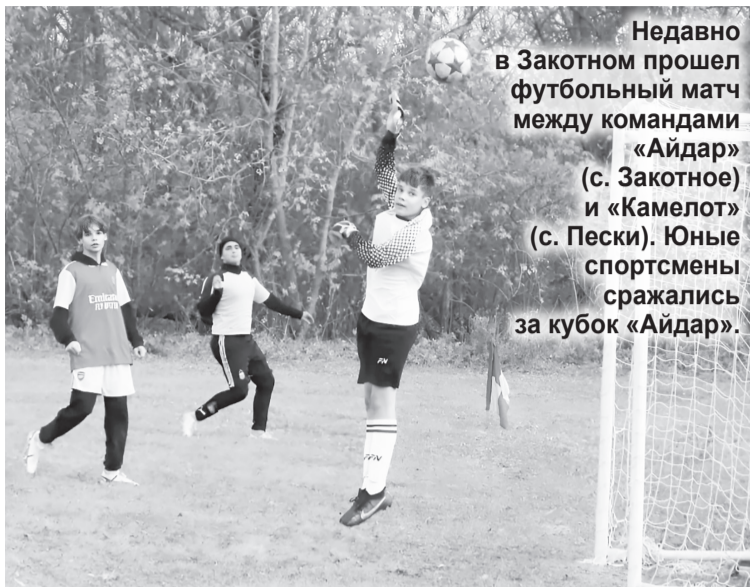
Недавно в Закотном прошел футбольный матч между командами «Айдар» (с. Закотное) и «Камелот» (с. Пески). Юные спортсмены сражались за кубок «Айдар».